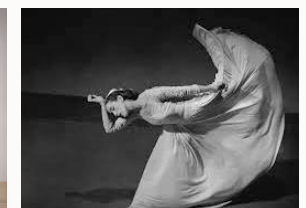
Slaske - Svirpe