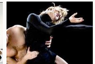
Glide - Vride