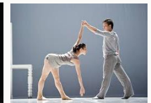
Duppe - flyde