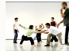
Presse - kan gå begge veje

Ofte skifter det undervejs - bemærk hvor det sker - beskriv overgangen.