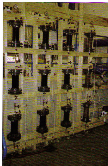
Figur 1. Forsøgsanlægget på Hvidovre Vandværk

Når forureningsfronten bevæger sig ned gennem aktivt kul kolonnen vil der forekomme tre zoner. Øverst i kolonnen nær indløbet er kullet mættet med pesticid og koncentrationen af pesticid i vandet omkring kullene er lig med indløbskoncentrationen. Nederst i kolonnen er kullet og vandet "rent" og frit for pesticid. Derimellem befinder der sig en overgangszone (massetransportzone), der bevæger sig nedad. Når overgangszonen når udløbet sker der "gennembrud" af forurening. Jo lavere grænseværdien er for pesticidet, jo før sker der gennembrud og jo før skal det aktive kul udskiftes. Derfor er rensningskapaciteten for aktivt kul desto lavere jo lavere grænseværdien for pesticidet er. Dette