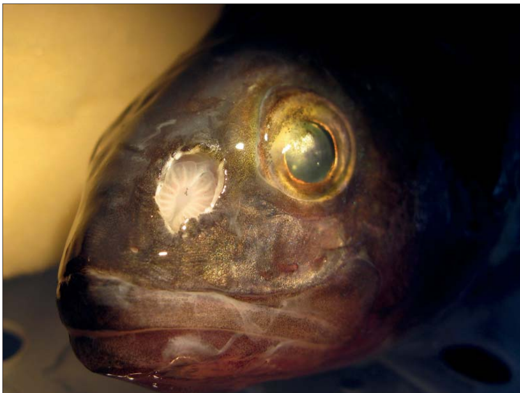
Aborre med åbnet lugteorgan. Ved at aflede nervesignaler fra lugteoverfladen kan lugteorganets følsomhed overfor lugtstimuli bestemmes. Sølv-nanopartikler nedsætter følsomheden overfor biologisk relevante lugte.

De negative effekter på fisk skyldes en blanding af nanopartiklerne og de sølvioner,