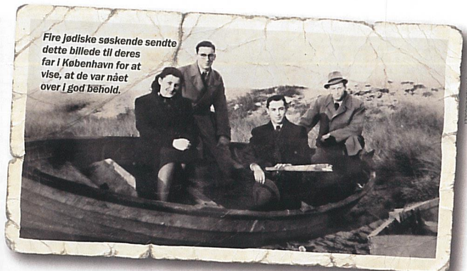
Fire jødiske søskende sendte dette billede til deres far i København for at vise, at de var nået over i god behold.

Kun en lille gruppe nyligt indvandrede jøder fra Rusland og omkring 30