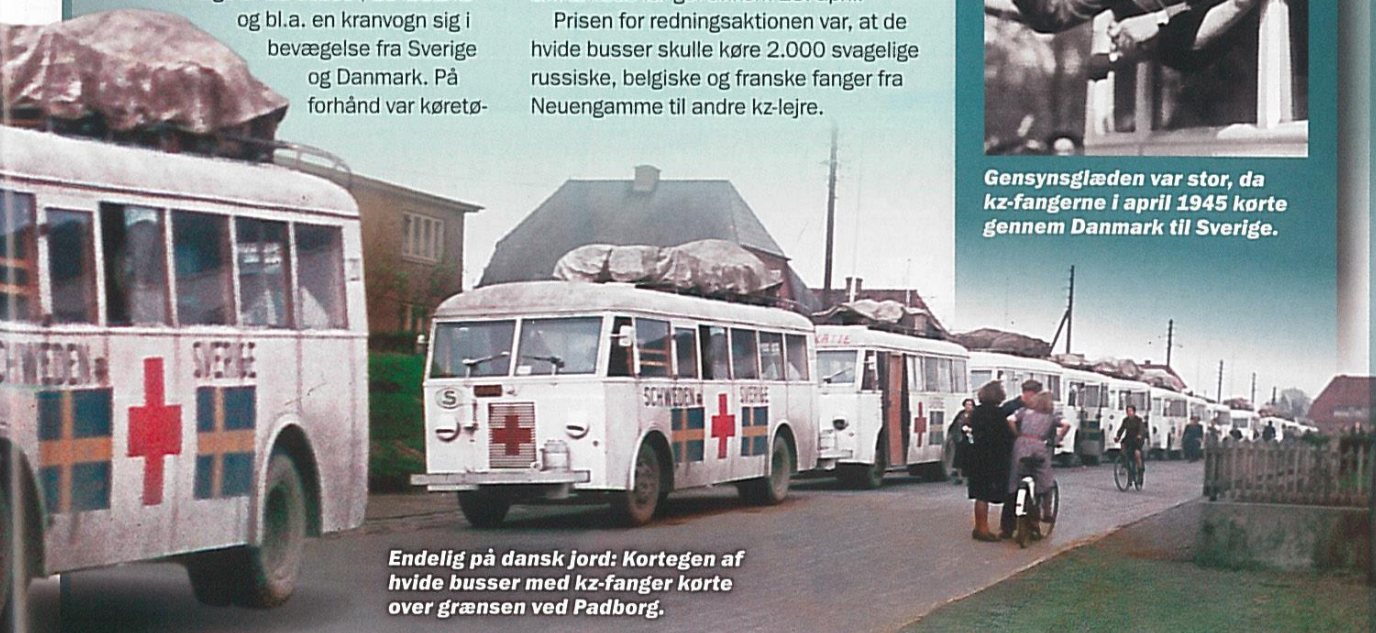
Endelig på dansk jord: Kortegen af hvide busser med kz-fanger kørte over grænsen ved Padborg.