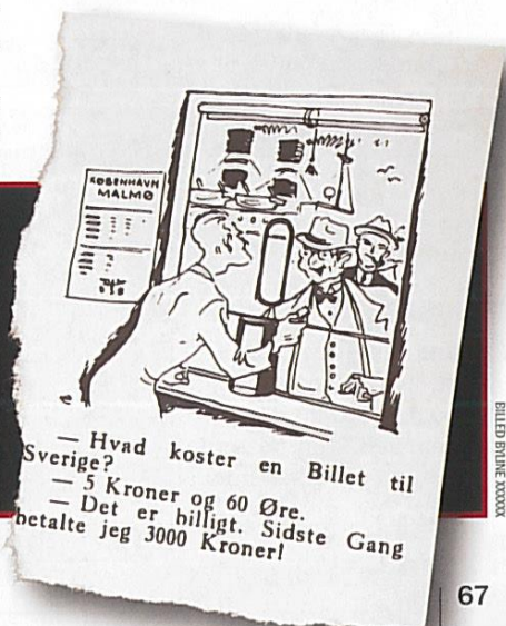
En satiretegning i Svikmøllen fra 1945 stillede skarpt på fiskernes priser.

Også denne pris syntes høj for en fattig familie, men fiskerne risikerede at miste deres livsgrundlag under et havari, eller hvis tyskerne tog deres skibe.