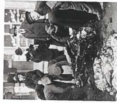
I Berlins gader kæmper indbyggere sig over en død hest for at sikre sig kød.

Ude på landet overlevede bønderne ved at