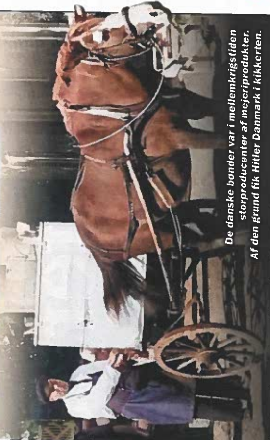
De danske bønder var i mellemkrigsstidens storproducenter af mejeriprodukter. Af den grund fik Hitler Danmark i kikkerten.

Hitlers endelige mål i Østeuropa var dog de store kornmarker i Ukraine, der ville give tyskerne næsten uendelige forsyninger. I 1940 invaderede nazisterne også Danmark i nord, som med et stort landbrugsoverskud og forholdsvis fredelige forhold var det rene slaraffenland for nazisterne.