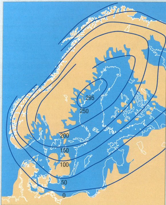
11.9 Kortet viser de områder af Norden der har været havdækket (dog ikke på samme tidspunkt) efter istiden

Desuden viser kortet ved hjælp af isobaser (linjer gennem steder med samme landhævning) hvor stor landhævningen har været i meter i forskellige dele af Norden. I Danmark er landhævningen foregået nord for en linje som går fra Nordfalster over Midtlyn til den jyske vestkyst ved Nissum Fjord. Syd for denne linje er der sket en svag nedsynkning.