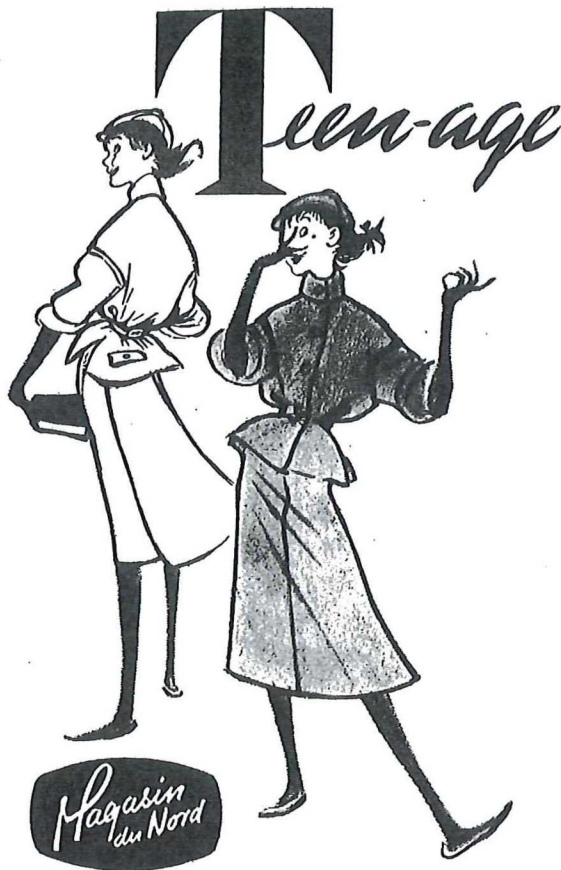
I 1951 åbnede Magasin en teen-age afdeling. Ungdommen blev i stigende grad skilt ud som en gruppe for sig.

hele taget helst blive ved med at være børn, til de kunne forsørge sig selv, selv om den tid først kom, når de var fyldt 18-20 år.