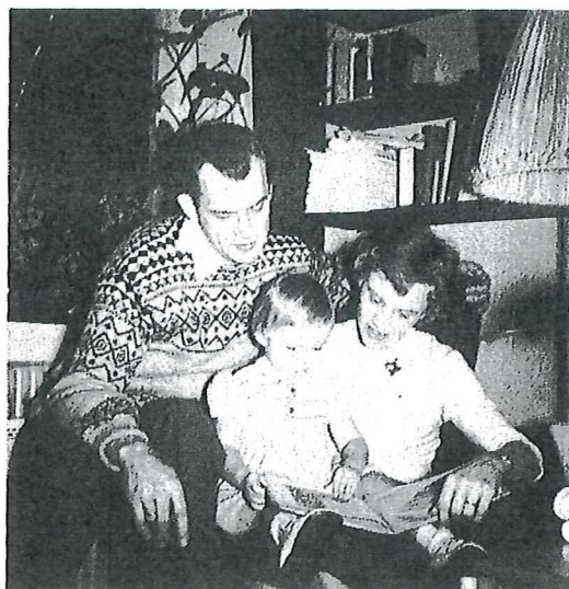
Det første barn 1957.

af lønarbejde hele deres liv, var raskest og stærkest som unge, de kunne ikke regne med at blive bedre til at forsørge en familie med alderen. Kun borgerskabets mænd og dele af landbefolkningen giftede sig fortsat sent. Mænd fra de højere sociale lag skulle først have sikret sig en god stilling, og gårdfolk og husfolk måtte fortsat vente med at gifte sig, til de kunne arve forældrene, eller til de selv havde sparet op til at købe et landbrug.