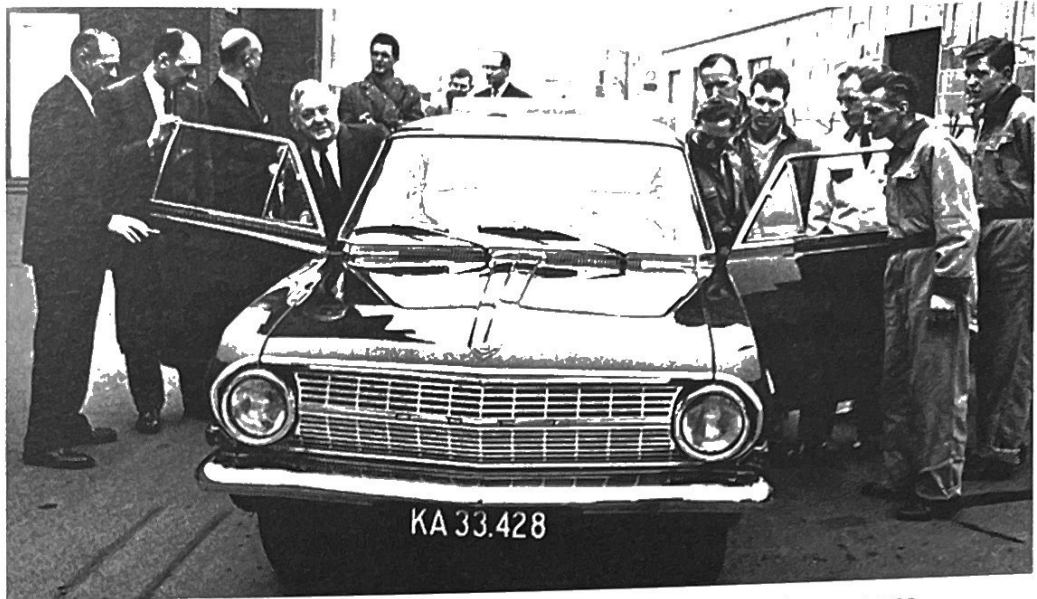
Direktion og arbejdere kigger på bil. General Motors i København, 1963.

I dette varesamfund bliver også fritiden til en vare. Inden for underholdnings-, hobby- og gør-det-selv-området vokser hele særindustrier frem. Det samme gælder for ferien. En hastigt voksende rejseindustri begyndte at masseproducere turistrejser i et udbud og til en pris, ingen havde kunnet drømme om tidligere.