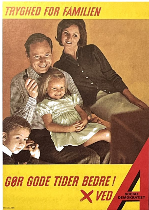
Socialdemokratisk valgplakat, 1960.

stor gennemslagskraft. Den folkelige holdning kommer frem på tre måder. For det første er der den måde, man behandler stoffet på. Nyhederne gøres til en slags dramatiske noveller, således at læserne kan identificere sig med de personer og begivenheder, der skildres. Ofte sejrer det dramatiske aspekt derved over det saglige og principielle, hvad der fører disse aviser ud i en politisk zigzagskurs. For det andet lægges der vægt på stof, der har med familie- og fritidsliv at gøre (div. læserbrevkasser, sladderspalter, sexrubrikker etc.). Endelig er der opsætningen; billedbrug og sprog gøres enkel og slagkraftig. Det hele markedsføres dernæst under et særligt populistisk image: »din avis«, »tør, hvor andre tier«, »med dig mod skrankepaverne«.