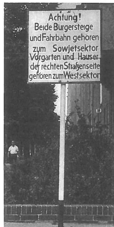
Absurditeten i det delte Berlin.

Specielt søgte Vesttyskland at isolere DDR ved samtidig med optagelsen af de diplomatiske forbindelser med Sovjetunionen i 1955 at afbryde forbindelserne, også økonomisk, med alle stater, der anerkendte DDR («Hallsteindoktrinen»).