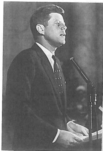
John F. Kennedy (1917-63) opfattedes af mange i og uden for USA som optimisme og fremtidens præsident. Efter hans mord i 1963 idealiseredes han, og Kennedy-myten opstod.