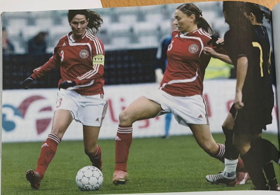
Ill. 19.9 Engang var det næsten umuligt at forestille sig, at kvinder en dag skulle begynde at spille fodbold. Billedet er fra en kamp mellem Danmark og Portugal i 2007, som Danmark i øvrigt vandt 1-0.

arbejde over, samtidig med at han igen føler, han svigter sin rolle som far, eller det kan tilsvarende være kvinden, der har svært ved at forene sin moderrolle med sin erhvervsrolle.