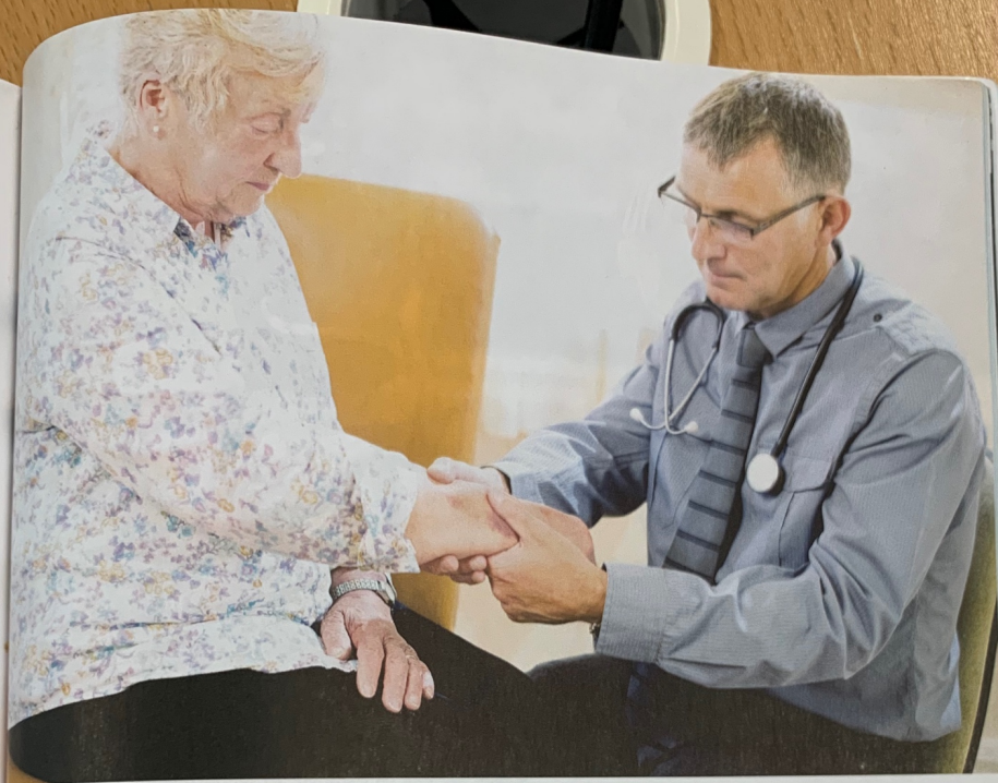
Ill. 19.8 Læge og patient.