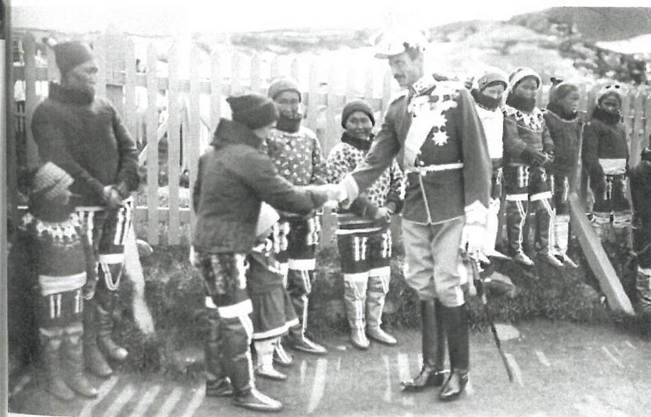
Christian 10. var som den første danske konge i Grønland. Velkomsten i Nuuk i 1921.

TEMA 3: Ændringer i danskernes holdninger og den danske statsmagts relationer til Grønland og grønlændere i det 20. århundrede illustreret igennem billeder af medlemmer af kongehuset på besøg i Grønland