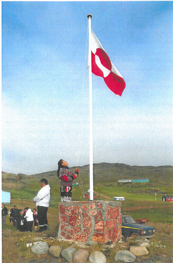
2 · GRØNLAND SOM DANSK KOLONI

Går man ind i Brugsen i Nuuk, ligner den på mange måder enhver anden dansk Brugs. Men Grønland er på en lang række områder samtidigt forskelligt fra Danmark. Den traditionelle fangerkultur er ikke uddød, men Grønland er på den anden side blevet et moderne samfund. Udfordringen for grønlænderne i dag er at definere, hvad grønlandsk kultur er, og hvordan det grønlandske samfund skal se ud med udgangspunkt i den dobbelte arv fra både fangerkulturen og de sidste godt 50 års lynmodernisering af Grønland.