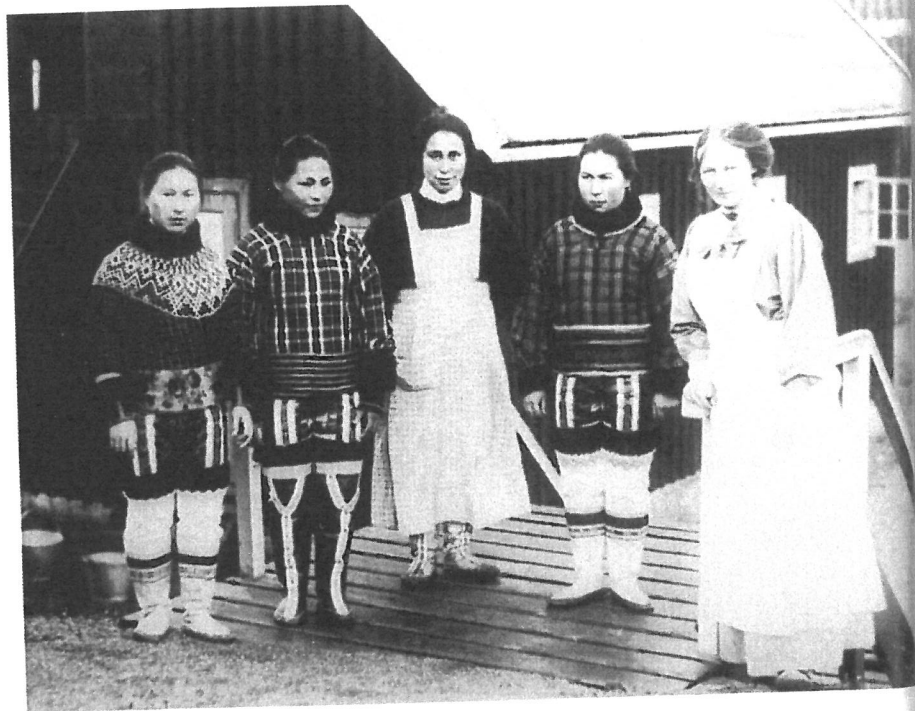
2 · GRØNLAND SOM DANSK KOLONI

Pengeøkonomien – og materielle goder udefra – vandt langsomt indpas fra midten af 1800-tallet. Almindelige boliger i Grønland var dog omkring år 1900 stadigvæk bygget af enten tørv eller sten og havde kun et rum, men de havde fået et vindue af glas i en træramme. De anorakker, både mænd og kvinder brugte, havde traditionelt været af skind, men blev nu syet af groft bomuldstøj. Kaffé, sukker, tobak, jagtrifler, gryder, pander og kaffekanden »Madam Blå« var blandt de varer, fangerne købte i de landhändler, som KGH drev. Den daglige kost var stadigvæk sæl, fugle og fisk. Bortset fra de få ting, der blev købt, blev alt, hvad man brugte og spiste i dagligdagen, stadigvæk fremstillet af fangerfamilierne selv.