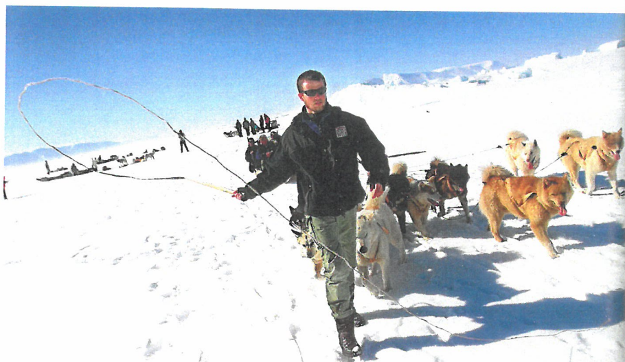
Kilde 8 Kronprins Frederik på en 2800 km lang slæderejse over den grønlandske indlandsis i 2000.