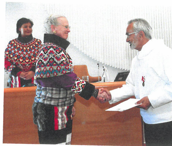
Dronning Margrethe overdrager Selvstyreloven på Grønlands nationaldag 21. juni 2009

I 2004 blev der nedsat en selvstyrekommission, der skulle se på forskellige modeller for den fremtidige relation mellem Danmark og Grønland. Arbejdet resulterede i Selvstyreloven, og 25.