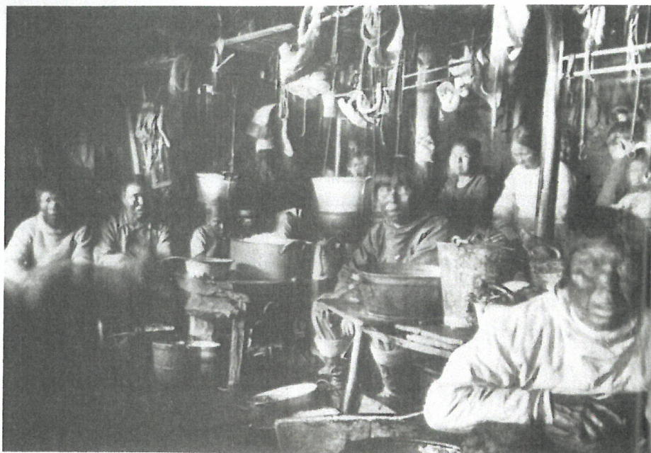
Kilde 4B: Fælleshus, 1924 (Østgrønland). Kilde: Nassat, 1985 s. 50 og 51. Foto 1924