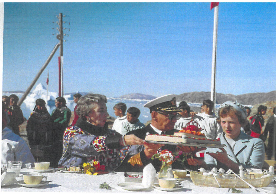
Kilde 7 Kongelig kaffemik. Frederik 9., dronning Ingrid og kronprinsesse Margrethe på besøg i Grønland, 1960.