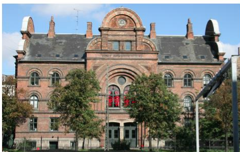
Figur 5.8 Dannerhuset i København blev bygget i 1873 som et sted for fattige kvinder. Huset eksisterer den dag i dag som et krisecenter for voldsramte kvinder og børn. Mænd har kun adgang til huset, hvis de har fået en særlig tilladelse.

Danner og Joan-Søstrene arbejder stadig med vold mod kvinder, og der er kommet flere organisationer og krisecentre til siden 1970'erne. Vold i dag bliver defineret som fysisk, psykisk, økonomisk, materiel, seksuel, digital vold og stalking.