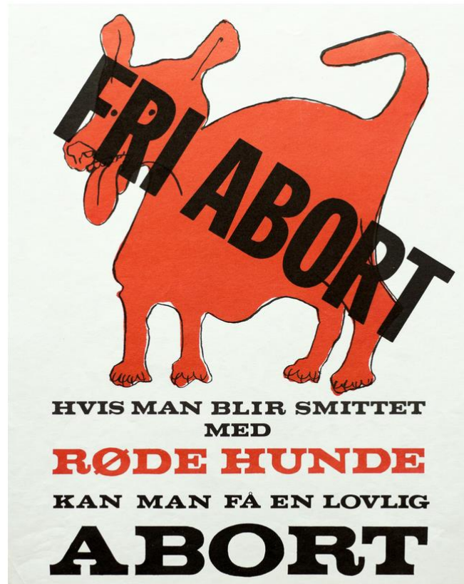
Figur 5.13 Kvinden kunne få foretaget en abort, hvis graviditeten medførte en helbredsmæssig risiko for hende eller fosteret. Det kunne f.eks. være, hvis kvinden havde sygdommen røde hunde. På den baggrund lavede foreningen Individ og Samfund i 1969 en kampagne, som lidt ironisk opfordrede kvinder til at blive smittet med røde hunde, hvis de ønskede en abort.