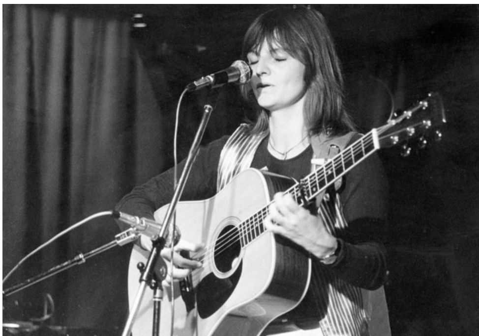
Figur 5.11 Den guitarspillende sangerinde Trille var meget populær i 1970'erne. Hun skrev sange om at være kvinde, om kærlighed, livet og ensomhed.

På den måde satte Trille i sine sange ord på nogle kvinders oplevelse af at være udkørte og trætte.