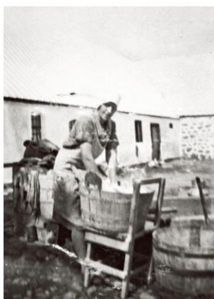
Figur 5.2 Kvinder har traditionelt haft ansvaret for familiens tøjvask. Ofte kunne det tage hele dagen et par gange om måneden og var et slidsomt arbejde. Det var hårdt for ryggen og gav røde og tørre hænder.