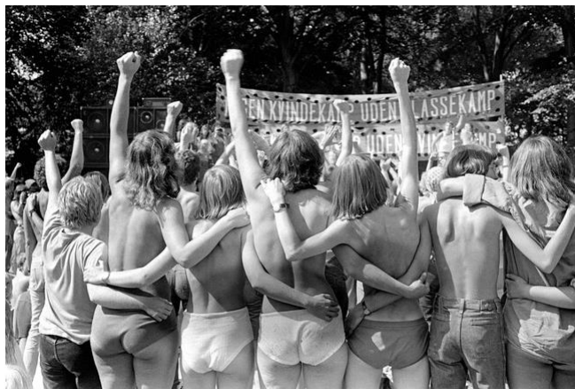
Figur 5.6 Slagudtrykket "Ingen kvindekamp uden klassekamp og ingen klassekamp uden kvindekamp" blev brugt i mange sammenhænge op gennem 1970'erne. Det udtrykte en forestilling om, at forholdene for kvinder i samfundet kun kunne ændres, hvis hele samfundet blev ændret.

selv. Når de fleste kvinder oplevede de samme former for undertrykkelse, mente mange rødstrømper, at der måtte være noget grundlæggende forkert ved samfundets opbygning. Samfundet skulle ændres. Ét af rødstrømpernes slogans var derfor: Ingen kvindekamp uden klassekamp!