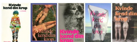
Figur 5.14 Forsider fra bogen Kvinde kend din krop . Bogen er udkommet flere gange med forskelligt indhold. Bøgerne afspejler derfor ændringer i kvinders levevilkår og tanker gennem flere årtier. Den seneste udgave er fra 2013.

Rødstrømpebevægelsen gav flere svar på dette spørgsmål. To sideløbende tendenser eksisterede. Den ene tendens fremhævede kvinden som et menneske med specielle levevilkår og en særlig krop. Både levevilkår og kroppen blev diskuteret og undersøgt i basisgrupperne, på ølejrene og i kvindehusene. I 1975 udkom bogen Kvinde kend din krop første gang. Det var det første oplysende opslagsværk til kvinder i alle aldre.