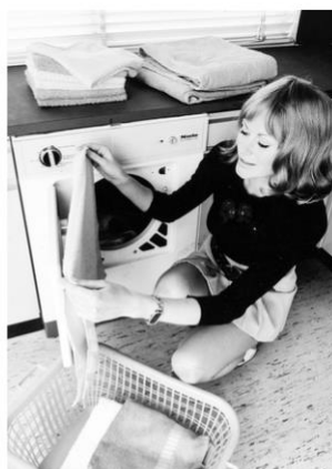
Figur 5.3 De elektriske hjælpemidler i hjemmet, som f.eks. vaskemaskinen og tørretumbleren, medførte store ændringer for mange kvinders dagligdag. Der er ikke oplysninger om, hvornår billederne præcis er fra.