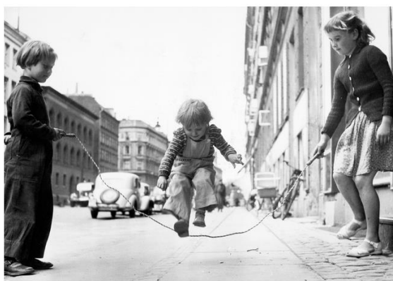
Figur 5.4 Børn sjipper i bue på et fortovet i København, ca. 1960. Børnene leger sandsynligvis uden at være overvåget af en voksen.

Mange kvinder havde dog lønnet deltidsarbejde ved siden af arbejdet i hjemmet. Deres arbejdstid var indrettet, så de kunne være hjemme, når børnene fik fri fra skole. Nogle kvinder arbejdede sammen med manden på familiens gård eller i familiens firma. De blev kaldt for "medhjælpende hustruer", og sproget markerede dermed, at manden havde det primære ansvar for virksomheden. Derved var 1960'erne og begyndelsen af 1970'erne præget af et hverdagsliv, hvor børn legede frit, når skolen var færdig. En leg, som i byerne foregik på gader og i baggårde. På landet: i skov, på marker og gårdspladser. Mødrene var hovedansvarlige for børnenes opdragelse og sundhed.