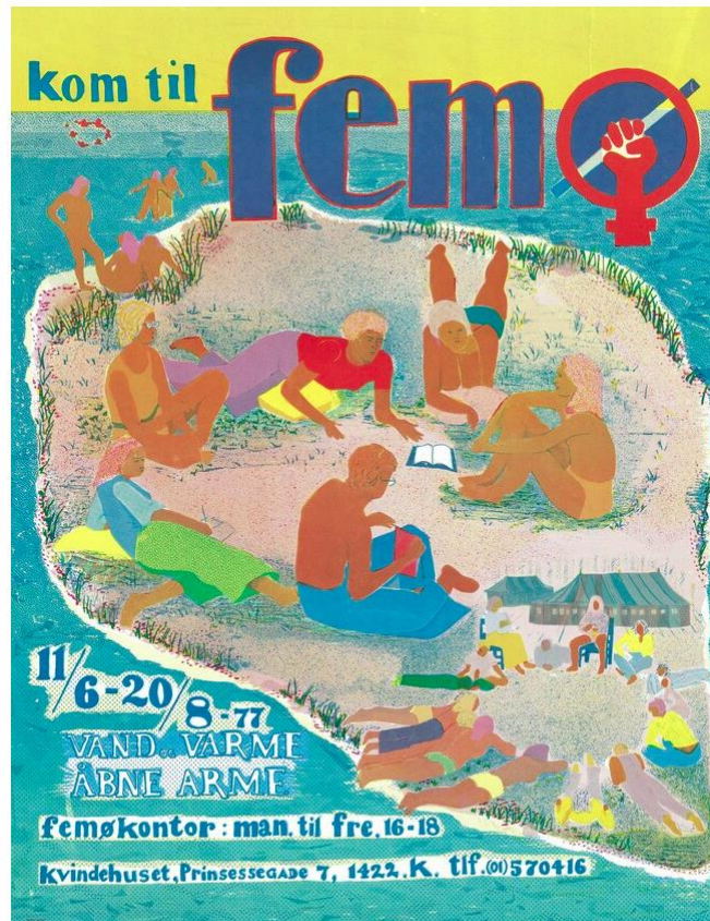
Figur 5.7 Plakat, som reklamerede for Kvindelejren på Femø 1977. Lejren har eksisteret fra 1971 og er fortsat i gang hver sommer. Den er kun for kvinder og for drenge under 12 år.

Konkret kom ønsket og behovet for fællesskab blandt andet til udtryk i oprettelsen af flere kvindehuse. Kvindehuse var huse, hvor kvinder boede sammen i kollektiver, og de fungerede som rådgivnings- og informationscentre og som mødested for basisgrupper.