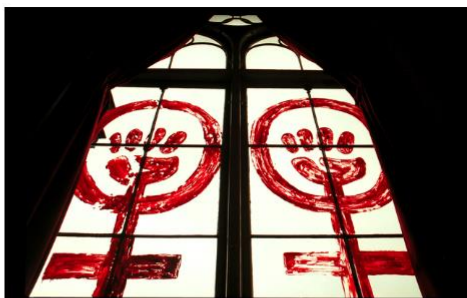
Figur 5.9 Det røde kvindetegn med den knyttede hånd i midten blev fra slutningen af 1960'erne symbolet for rødstrømpebevægelsen i både Danmark og resten af den vestlige verden. Den røde farve og den knyttede hånd symboliserer, at kvindekampen og socialismen blev betragtet som en samlet kamp.

Rødstrømpebevægelsens aktioner ebbede ud i 1980'erne. Herefter opstod andre og nye kvindefællesskaber. F.eks. opstod bevægelsen "Kvinder for Fred" omkring år 1980. Det var én af mange grupper af mennesker i den vestlige verden, som havde fokus på at bekæmpe krig, og som opstod med baggrund i den kolde krig og angsten for atomvåben.