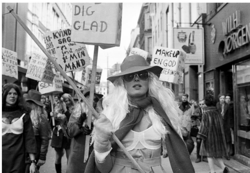
Figur 5.10 Den 8. april 1970 demonstrerede en lille gruppe kvinder mod den forskelsbehandling mellem mænd og kvinder, de oplevede i det danske samfund. De gik igennem Strøget i København med skilte med ironiske slogans. De havde blandt andet BH'er uden på tøjet, fordi de ønskede at vise, at de syntes, at der blev stillet en masse overflødige og undertrykkende krav til kvinder – både til, hvordan de skulle opføre sig, og til, hvordan de skulle gå klædt.

Nogle kvinder mente ikke, at fagbevægelsen gjorde nok, og den 8. april 1970 gik en lille gruppe kvinder gennem Strøget i København for at demonstrere for ligeløn. Turen var delt i to. På den første del af turen var kvinderne pyntet med ballonbryster, kunstige øjenvipper og skilte med slogans som "Lykke er at vaske HANS og børnenes tøj" og "Et køleskab for det daglige knald". På den anden del af turen havde kvinderne smidt alle de ydre symboler på pyntet kvindelighed i skraldespanden og bar nu skilte med budskaber som "Frihed, lighed og søsterskab" og "Vask kun din egen sok – nu har du sgu' vasket nok". En måneds tid senere aktionerede nogle kvinder i en bus ved at nægte at betale samme pris for en billet som mændene. De ville kun betale 80 % af prisen, hvilket svarede til den forskel, der var mellem kvinder og mænds lønninger. Kvinderne blev pålagt en bøde, som de så igen nægtede at betale mere af end 80 %.