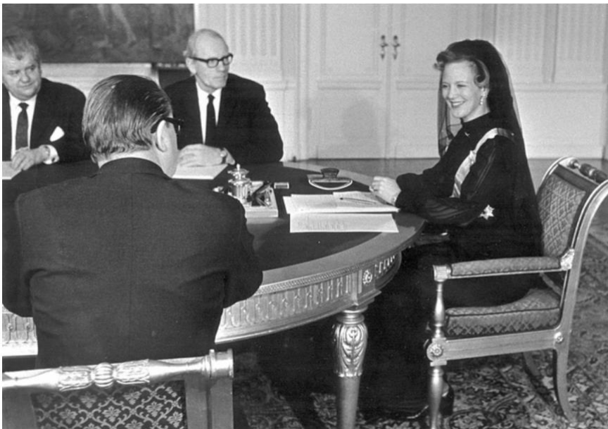
Figur 5.1 Dronning Margrethe d. 2. sidder ved sit første møde med regeringen i januar 1972. Det var dagen efter, at hendes far, kong Frederik d. 9, var død, og hun var derfor klædt i sørgedragt.

I efterkrigsårene kom flere gifte kvinder på arbejdsmarkedet end tidligere. Hvilke årsager medvirkede til den udvikling? Fra 1960'erne og frem strømmede kvinderne i stort antal ind på arbejdsmarkedet, og med tiden oplevede mange, at de ikke længere var økonomisk afhængige af en mand. Hvad betød det for kvinder, mænd, familier og samfundet?