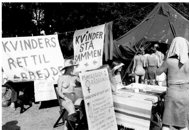
Figur 5.15 Fra Kvindefestivalen i Fælledparken i København 1976. Skiltene viser tydeligt, hvordan rødstrømpebevægelsen havde fokus på, at kvinder burde stå sammen og være solidariske med hinanden i kampen for ligestilling og for kendskab til eget værd.

Mange kvinder oplevede, at deres indtræden på arbejdsmarkedet satte dem i konflikt med det traditionelle kvindeansvar for hjemmet. De oplevede, at de havde dobbeltarbejde og blev undertrykt. De mente, at mændene fik lov til at slippe for ansvaret for hjemmet, og at det var en del af en større samfundsmæssig patriarkalsk tankegang, hvor mændene bestemte det hele. Nogle rødstrømper gik så langt, at de kaldte ægteskabet for en "slavekontrakt", fordi kvinden med indgåelse af ægteskab ikke kun valgte en mand, men også det fulde ansvar for pasning af ham, hus og børn.