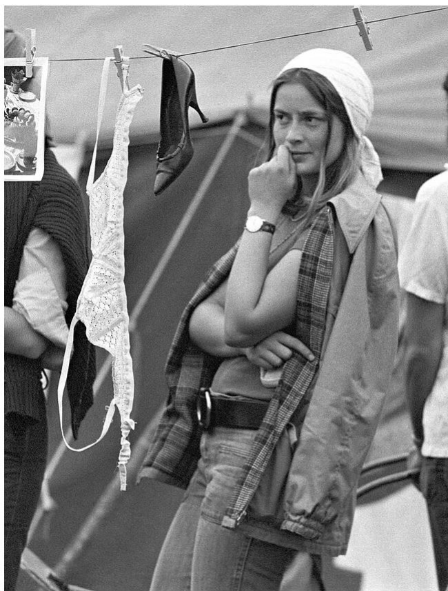
Figur 5.0 Foto fra den første Kvindefestival i Fælledparken i København, august 1974. Kvinden står og ser på en tøjsnor, hvor nogen har ophængt traditionelle beklædningsgenstande til kvinder. Sandsynligvis et kunstnerisk udtryk for, at nye tider var på vej. I hvert fald havde mange af de festivaldeltagende kvinder smidt BH'en og gik rundt, dansede eller sad på græsset i solen med frie, bare bryster.