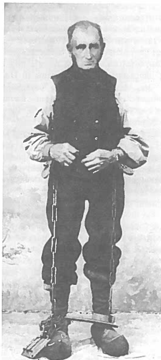
Fig. 12. Lænkningsmetoden af farlige forbrydere ændrede sig stort set ikke de næste 100 år, hvad dette billede viser. Her har en vægter indvilget i at lade sig fotografere i de hånd- og fodlænker, som morderen Rasmus Mørke bar i Hobro arrest 1880-81, mens han ventede på at blive henrettet.