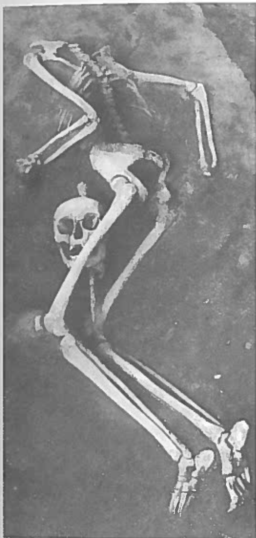
Fig. 4. Da man udgravede galgebakken i Slots Bjergby ved Slagelse, fandt man liget af denne halshuggede forbryder, hvis hoved er anbragt mellem hans ben i graven. Hovedet er desuden gennembanket af en jernspiger, hvilket viser, at det har været sat på en stage, ligesom tyvedommen fra Helsingør krævede.

kirke: "Manden som stimand straffes på livet således, at først skal hans højre hånd, mens han lever, afhugges med en økse, dernæst skal også hovedet med en økse skilles fra kroppen, hvorefter hovedet sammen med hånden skal fastnavles på