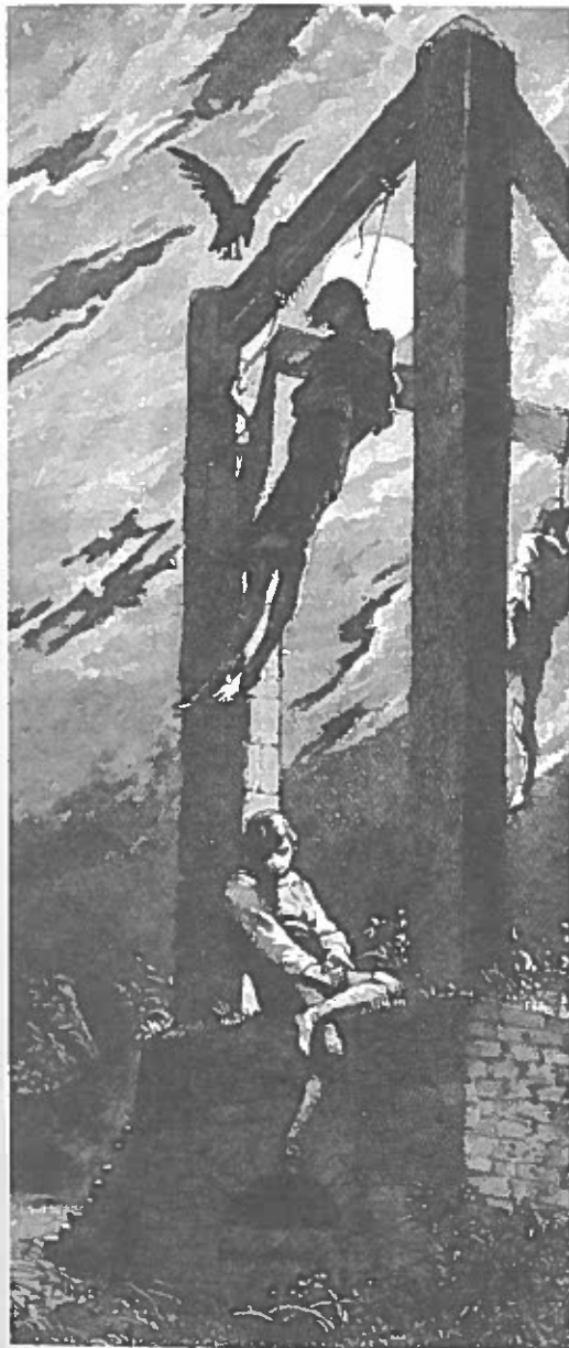
Fig. 7. Hængning var den almindelige vanærende straf for tyveri. Sådanne "galgenfugle" dinglede på galgebakkerne i renæssancens Danmark, indtil de rådne. Hensigten var naturligvis at afskrække folk fra forbrydelse, men folketroen dyrkede ofte galgebakken og de hængte. Således kunne man bruge afhuggede, tørrede forbryderfingre til alskens gode magiske formål.

anbragt på en for- torv, nær kirke og m for henrettelser ikke gik glip af på kag'en bestod en gav forbryderen med piskeriset på t var ikke alene en eret mistede ofte i sin hud - det var digelse. Efter en en fremtid mere i dnu værre var det erket. Mærkningen