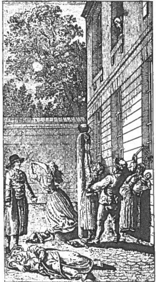
Fig. 8. På dette stik fra en bog oversat fra tysk i 1797 er en flok kvinder ved at blive kagstrøget for tyveri eller hor. Hvilken holdning har kunstneren mon til straffen?

Endelig idømtes stadig - omend i mindre omfang - middelalderlige straffe (se s. 12) som gabestok, slæbning af tunge sten gennem byen ("bæren sten af by") og offentligt skriftemål for en række mindre forseelser såsom banden og sværgeren,