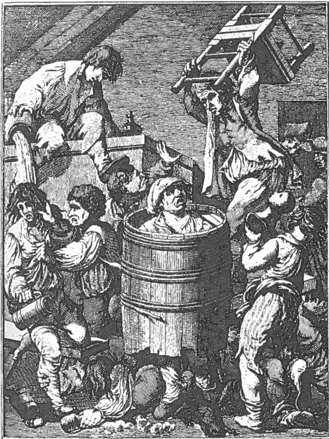
9. "Den spanske kappe" var en tønde uden bund og med hul til hovedet i den øvre ende. Forbryde- ren skulle gå rundt på gaden et bestemt stykke tid til spot og spe. Straffen var således alene vanærende - ikke forbundet med smerte. På dette stik fra 1772 af kunstneren Wiedewelt i Holbergs "Peders Paars" vises samtidig en af årsagerne til, at man kunne ende i "den spanske kappe".

r. d. 4 en ny straf- k, der var mindre merholm-forbry- arbejdstugthus. at samle alle de og tiggere, som de nkturer, krig og lt ud på landeve- len kom "Huset" kvinder og børn. ) sad ialt 6000 fat- riminelle, hoved- e børn, bag insti- tre og blev - hvis de mange epide- Huset" - opdraget nyttige samfunds- ære et erhverv, f. e kunne klare sig, - en kombination og statsudbytning har været meget I det nedenståen- husets reglement ehåndsendtryk af set og livet bag et "Thi kendes for Danmark" (se s. empler på børne- rydelser og straf- eologien ca. 1500- l baggrunden for affepraksis blive n have lyst til at is-lemmerne op- n besøge Hellig-