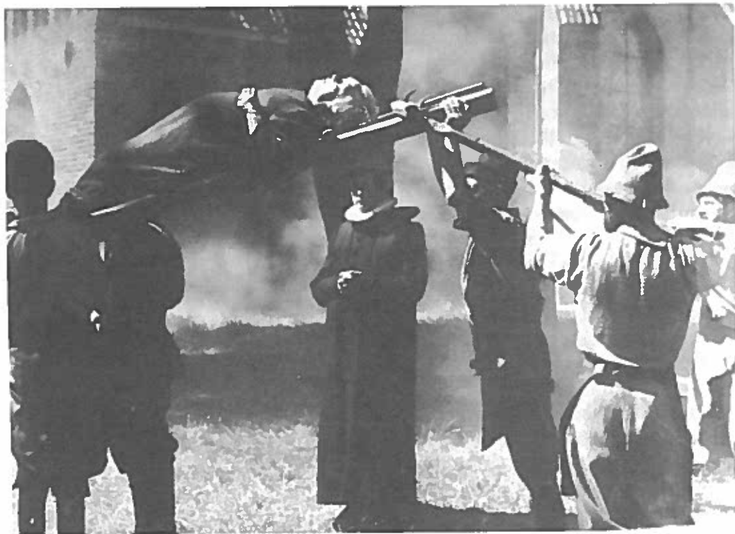
Fig. 6. Heksebrænding i Danmark foregik ved, at heksen blev bundet til en stige, som derefter blev væltet ind i det flammende bål. Still fra Carl Th. Dreyers film "Vredens dag".

Kag'en var en pæl, anbragt på en forhøjning gerne på byens torv, nær kirke og rådhus. Det var ligesom for henrettelser vigtigt, at publikum ikke gik glip af noget. Afstraffelsen på kag'en bestod almindeligvis i, at bødlen gav forbryderen det idømte antal slag med piskeriset på dennes nøgne krop. Det var ikke alene en smertefuld straf – offeret mistede ofte i bogstavelig forstand sin hud – det var også en dyb nedværdigelse. Efter en sådan havde man ingen fremtid mere i det lokalsamfund. Endnu værre var det dog at blive brændemærket. Mærkningen