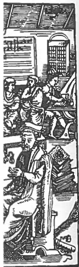
(pisken) spiller en væ-