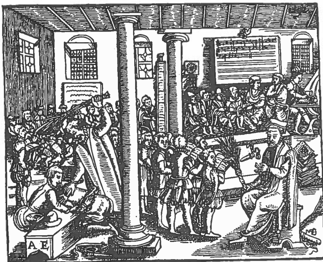
Fig. 3. På billedet af dette klasseværelse fra 1590 er det tydeligt, at riset (piscen) spiller en væsentlig pædagogisk rolle.

Og henrettelser og andre legemlige afstraffelser var der nok af mellem ca. 1500 og 1800. Selvom Helsingør som havneby måske var speciel barsk, kan bød- lens travlhed her give et fingerpeg om de almene tilstande i tiden og landet. Således henrettede skarpretteren i Helsingør mellem 1570 og 1581 mindst 14 “gode” borgere. Hertil kom at ikke mindre end 27 sørøvere af “udenbys” oprindelse alene i 1571 prydede hjul og stejler på Helsingør toldbod. Og det bliver ved med at vrimle med dødsdomme i tingbøgerne, som denne fra Helsingør i 1721, hvor et ægtepar er fundet skyldigt i tyveri fra en