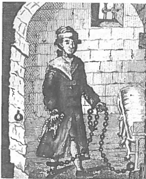
Fig. 11. Fremstillingen af Struensees fængselsforhold i kastelet er mere realistisk end fig. 10's fængselsbillede, s. 28.

Endelig dukker en gammel straf, der skulle vise sig at have fremtiden for sig, op igen i 1866: Bøder. De lød på fra 1 til 2000 rigsdaler og tilfaldt statskassen.