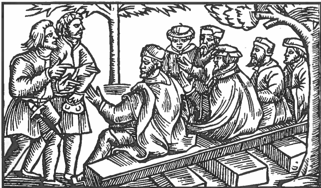
Fig. 1. Her på dette stik af Olaus Magnus har det gamle middelalderlige rettertings medlemmer taget plads på "tingstokken" for at høre de stridende parter i en sag.

Vi ville nok blive lidt overraskede, hvis vi "dumpede" ind til en middelalderlig proces omkring år 1200. Her kunne man endnu komme ud for, at den anklagede forsøgte at rense sig ved at bære jernbyrd. For at bevise sin uskyld skulle han bære et stykke glødende jern i sine bare næver. Kunne han det uden at blive forbrændt, måtte Gud have bevist hans uskyld. Selvom der således var tale om et "religiøst ritual", var kirken meget imod jernbyrd-bevist. Generelt gælder, at den