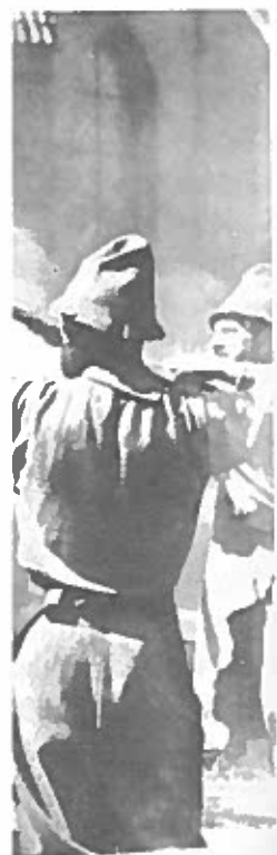
en stige, som derefter ens dag".

bestod i, at forbryderen fik stemplet en galge eller et hjul på sin pande eller hånd med glødende jern. Så var hans fremtid ikke alene ødelagt lokalt. I visse tilfælde prydede bødlen også kag'en med afskårne fingre og ører til skræk og advarsel.