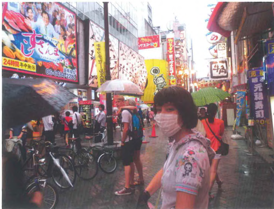
I Japan anses det for god skik at bære mundbind, for ikke at smitte andre. Hvordan ville det blive opfattet i Danmark?

Hvad der er godt og ondt, afhænger af de værdier, som man har i det pågældende samfund på det bestemte tidspunkt. Etik handler altså om værdier. Alle kulturer kategoriserer ud fra værdier, men det er ikke altid tydeligt, hvilke værdier, der gør sig gældende i et samfund, og samfundets deltagere har heller ikke nødvendigvis noget klart billede af disse. De bliver tillært gennem social interaktion i form af opdragelse, hjemme og i samfundets institutioner.