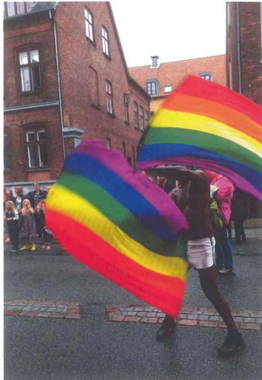
Det regnbuefarvede flag er et symbol for den mangfoldige seksualitet og bliver brugt ved Pride-optog verden over.

biske, biseksuelle og transpersoner. Forkortelsen er det engelske: Lesbian, gay, bisexuals, transgender) den mest fremtrædende interesseorganisation for homoseksuelle.