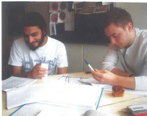
Hvad afgør hvilke valg vi tager?

Hvis man skal analysere de forskellige handlingsmønstre i øvelsen og i en større skala i forbindelse med den enkelte persons valg i alle givne situationer, må man gribe til filosofiens teoretikere. Jean-Paul Sartre ville med sin eksistentialistiske holdning mene, at hver person frit vælger, hvordan det vil være som menneske. Der er således ikke nogen undskyldning for de valg, man træffer. Abigail skaber med sit valg sit eget livsindhold (essens). Hun vælger ikke kun for sig selv. Hun vælger på hele menneskehedens vegne, idet hun gør "utroskab" til en værdi, blot fordi hun vælger det. Men de andre aktører i historien vælger også frit, hvordan de handler i de givne situationer, som de bliver sat over for.