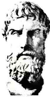
137. Filosofen Epikur Marmorbuste 3. – 2. århundrede f. Kr.

Autárkeia (αὐτάρκεια): selvtilstrækkelighed, det at være selvberørende