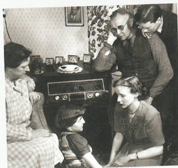
Foto: En familie lytter til radio