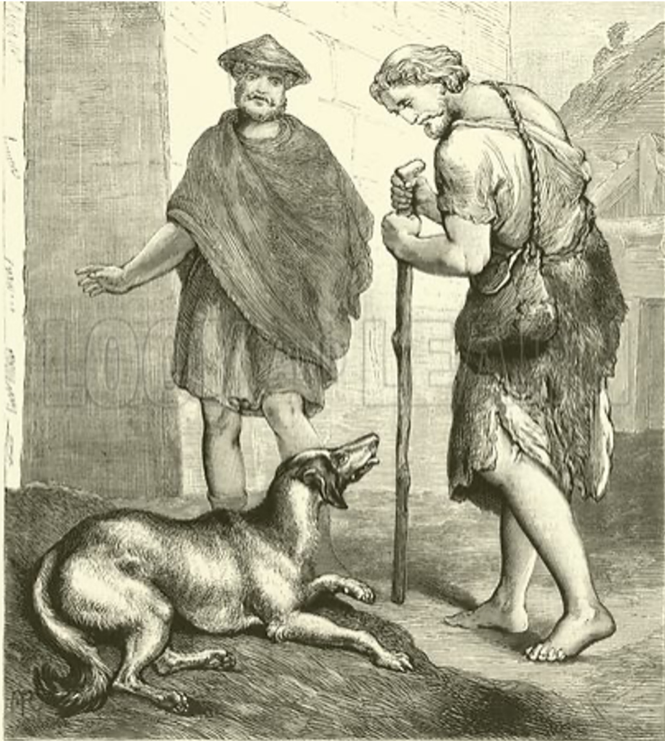
Ulysses recognized by his old dog Argus.