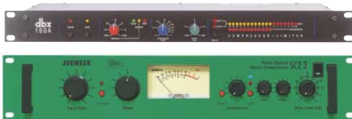
Joemeek SC2.2 (nederst) er et eksempel på en optisk kompressor. dbx 160A er en moderne udgave den klassiske dbx 160 kompressor. Indmaden er nærmest uændret siden 70'erne.

gelse og det instrument, som er ens i denne verden. Brug derfor kun de følgende eksempler som et udgangspunkt for dine egne indstillinger.