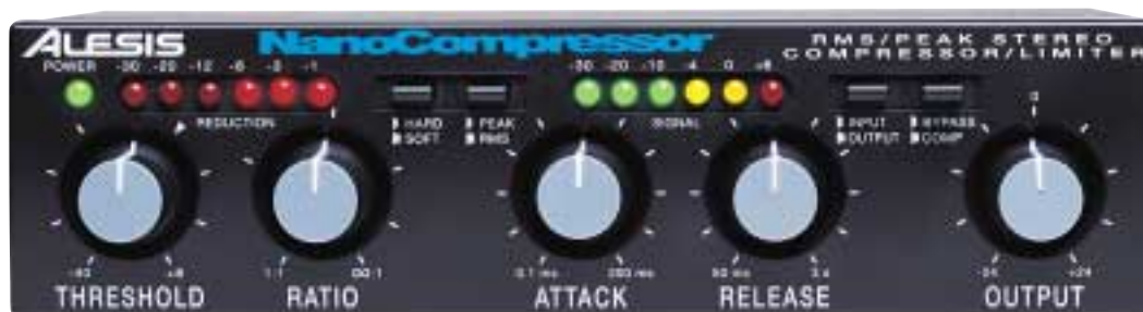
Alesis NanoCompressor er givetvis ikke den bedste kompressor i verden, men har netop de parametre, som vi omtaler i artiklen: Threshold, ratio, attack, release, output og hard/soft-knee. Den er tilmed rigtig billig.

Kompressoren er et af den trænede studieteknikers sidste bastioner. Rigtig betjening af en god kompressor er det, som sætter prikken over i'et, gør det meget lettere at samle et komplekst lyd-billede til et miks og som adskiller en professionel tekniker fra en amatør.