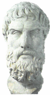
137. Filosofen Epikur Marmorbuste 3. – 2. århundrede f. Kr.

Autárkeia (αὐτάρκεια): selvtilstrækkelighed, det at være selvberørende