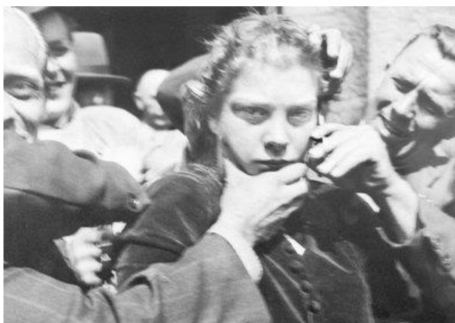
En såkaldt "tyskerpige" klippes i dagene efter befrielsen, Maj 1945.

Trods den megen kritik og de mange kontroverser slap Danmark dog relativt heldigt fra sit retsopgør. Stemningen i befolkningen krævede et opgør, og i forhold til mange andre lande blev udstrakt selvjustits fra befolkningens side undgået.