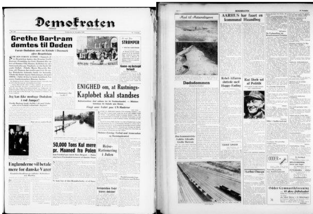
Forsideartiklen om Grethe Bartrams dødsdom og fortsættelsen på side 8 i Demokraten den 29. november 1946.

Nedenstående artikel fra den aarhusianske socialdemokratiske avis Demokraten omtaler domfældelsen over Grethe Bartram og illustrerer offentlighedens opmærksomhed på sagen.