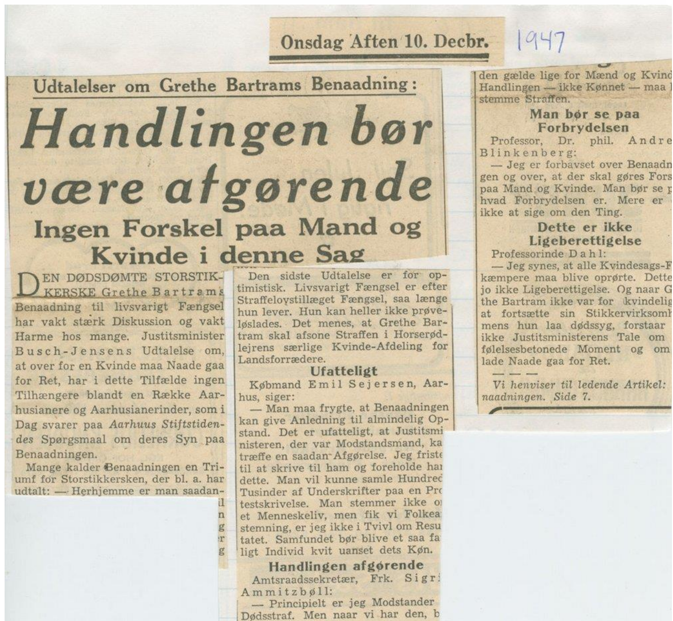
Udklip fra Aarhus Stiftstidende den 10. december 1947.

Kildeintroduktion: Nærværende uddrag af Aarhus Stiftstidende 10. december 1947 citerer forskellige udtalelser vedrørende den almindelige holdning til Grethe Bartrams benaadning.