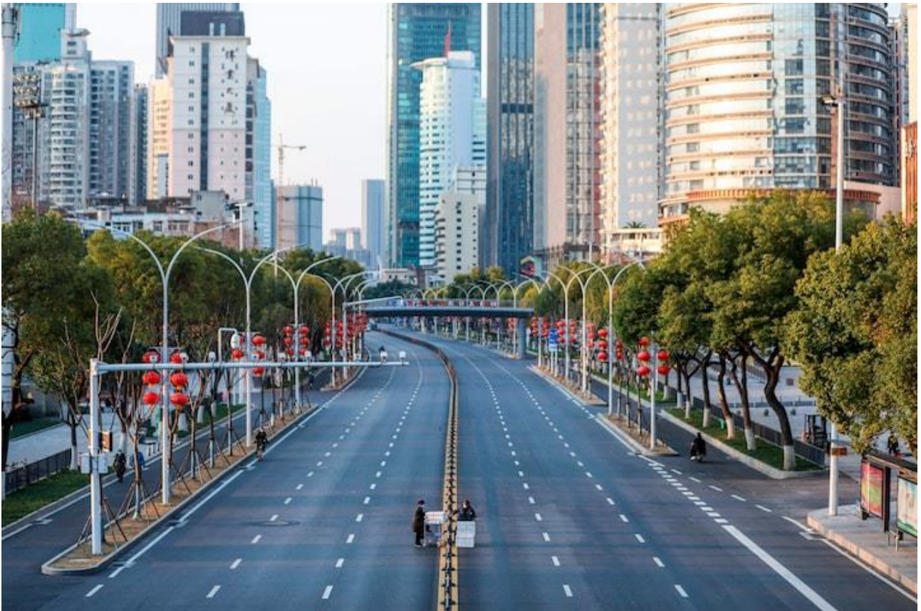
Coronapandemien har taget hårdt på Kina. Her er det et billede fra en tom gade i millionbyen Wuhan i 2020, hvor det hele startede.

Forretningsfolk, turister og rejse-influencer er begyndt at vende tilbage til Kina. Min egen Kina-fokuserede instagram er et langt rul af brugere, der taler om, hvor overraskede de er over den teknologiske udvikling i Kina: El-biler, metroer, højhastighedstog, flyvende biler og drone shows.