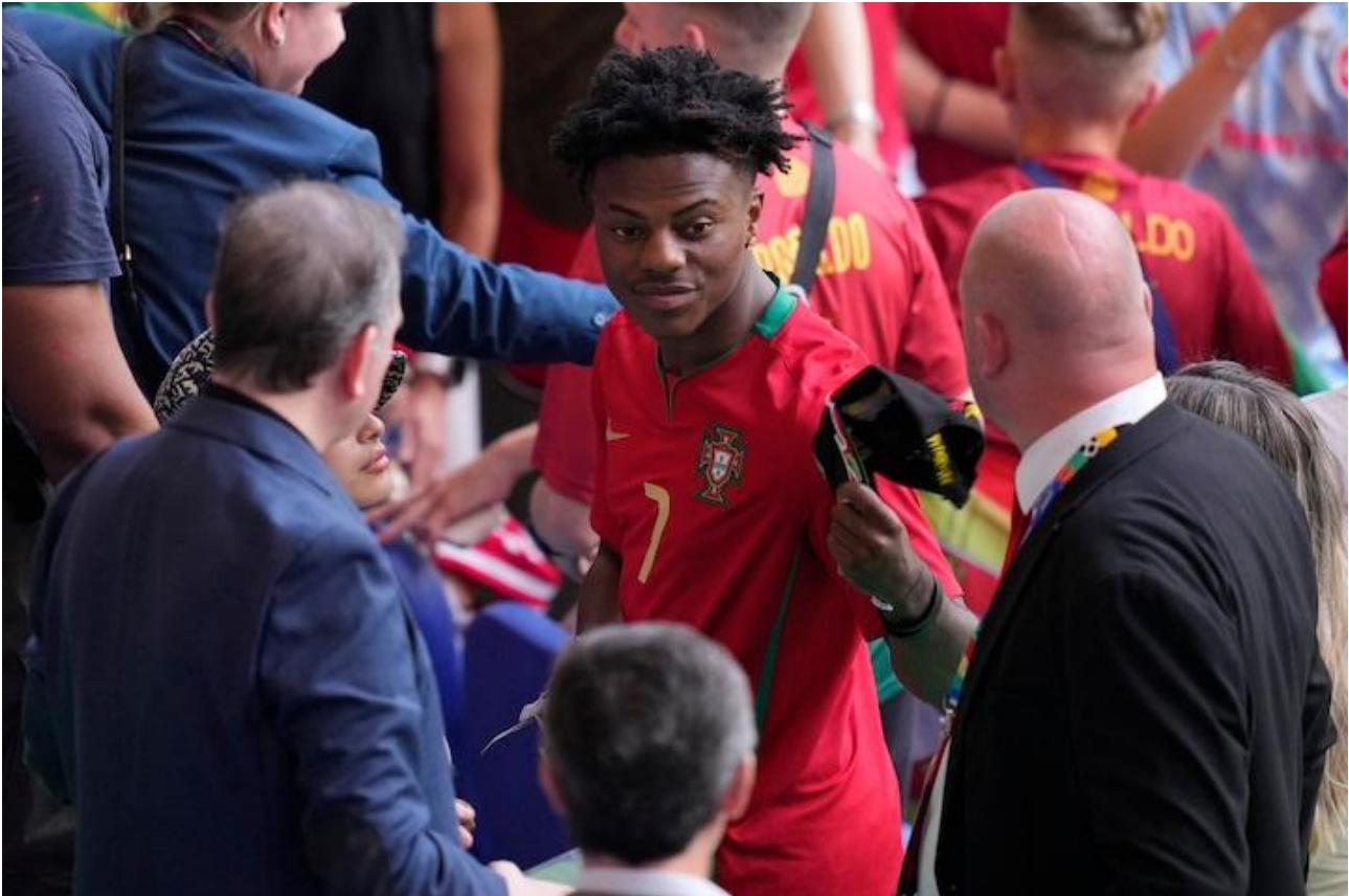
Den amerikanske YouTuber IShowSpeed, der går under navnet Darren Jason Watkins Jr., har opnået stor succes verden over med sine videoer. Her ses under sidste sommers EM-slutrunde i fodbold. Speed er stor fodboldfan og særligt stor fan af den portugisiske superstjerne Cristiano Ronaldo.