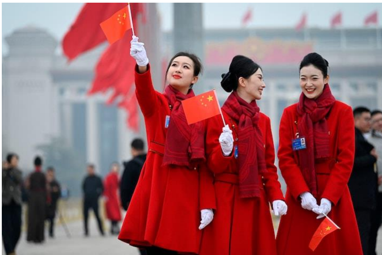
Kinesere på gaden i Beijing

Programmet retter sig primært mod forskere i STEM-kategorien (Science, technology, engineering, mathematics), hvor regeringen har færre begrænsninger for, hvad forskere må forske i.