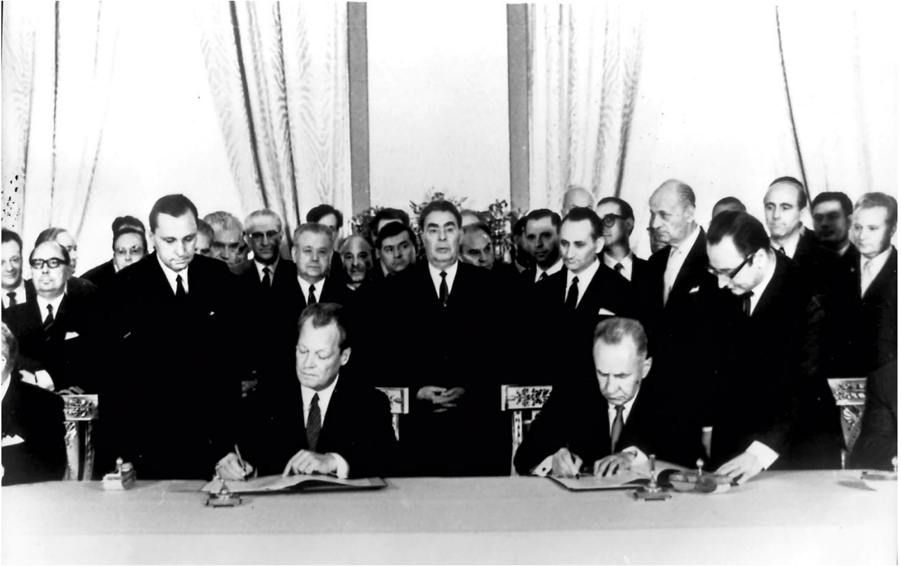
Den tyske kansler Willy Brandt indledte i 1970'erne en afspændingspolitik over for Østeuropa. Her underskriver han (til venstre) en ikke-voldsaftale med Sovjetunionen sammen med den sovjetiske regeringsleder Aleksei Kosygin. Midt imellem de to står den sovjetiske generalsekretær Leonid Brezjnev. Moskva 1970.