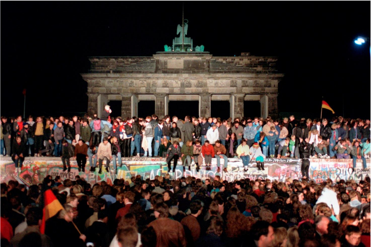
Berlinmurens fald i 1989 kom til at symbolisere sammenbruddet af det kommunistiske Østeuropa.

De østeuropæiske oppositionskredse opfattede med god grund Gorbatjovs afspændingspolitik som tegn på svaghed, og i de regerende kommunistpartier vaklede troen på, at Sovjetunionen ville opretholde deres regimer med magt som i 1953, 1956 og 1968. Dermed var grunden skredet under de østeuropæiske kommunistiske regeringer. Som faldende dominobrikker opgav de en efter en magten i løbet af efteråret 1989 under indtryk af et massivt folkeligt pres.