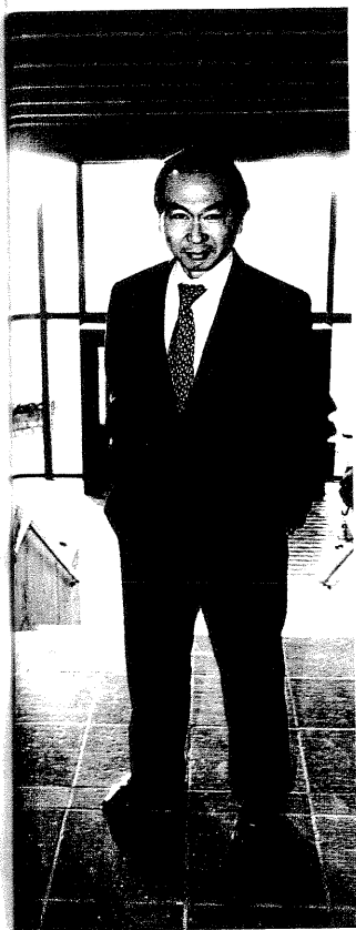
Francis Fukuyama på besøg i Danmark.

Fukuyama beskriver, hvordan det liberale samfund har styrket sin position i verden i de sidste 200 år. Liberalismen manifesterede sig for første gang med den amerikanske og den franske revolution i slutningen af 1700-tallet. I løbet af 1800-tallet fortrængte den i Vesteuropa de traditionelle, feudale monarkier, men i 1900-tallet løb det liberale demokrati ind i modangreb fra totalitære ideologier, fascisme, nazisme og kommunisme.