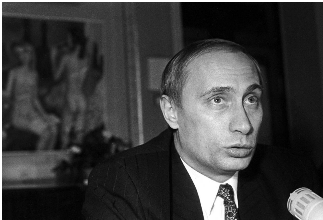
Putin på en pressekonference i 1995, dengang han var viceborgmester i Sankt Petersborg.

tiltrædelsestale få uger senere talte han om myndighedernes forpligtelse til at beskytte russiske statsborgere overalt – »både inden for og uden for landets grænser«.