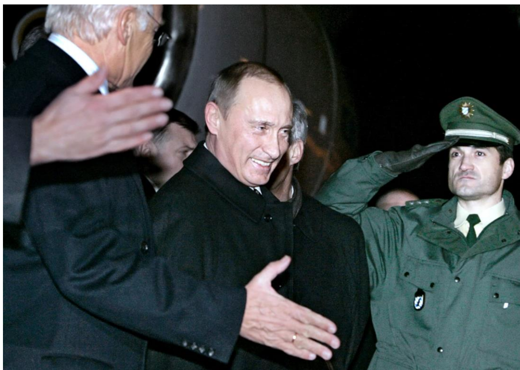
Putin ankommer til sikkerhedskonferencen i München i 2007.

»Det er en stor misforståelse blandt eliten i Rusland, at de fleste ukrainere ventede på, at Rusland skulle komme og redde dem. Man bruger ordet 'landsmænd' til at retfærdiggøre interventioner i andre sovjetstater, og man bruger det på en måde, som ligner det internationale humanitære sprog for interventioner.«