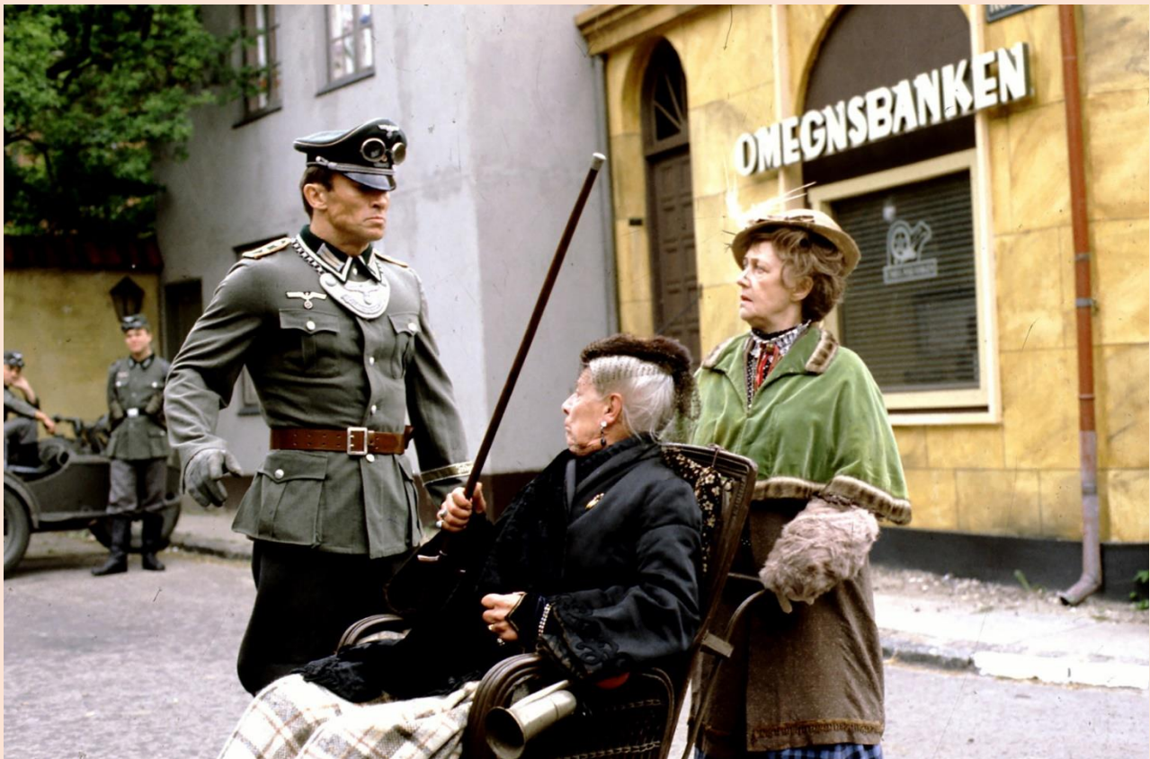
Tante Møghe og Misse i et ublidt møde med en tysker.

Kilde: Historiker Bo Lidegaard, Politiken den 12. september, 2016