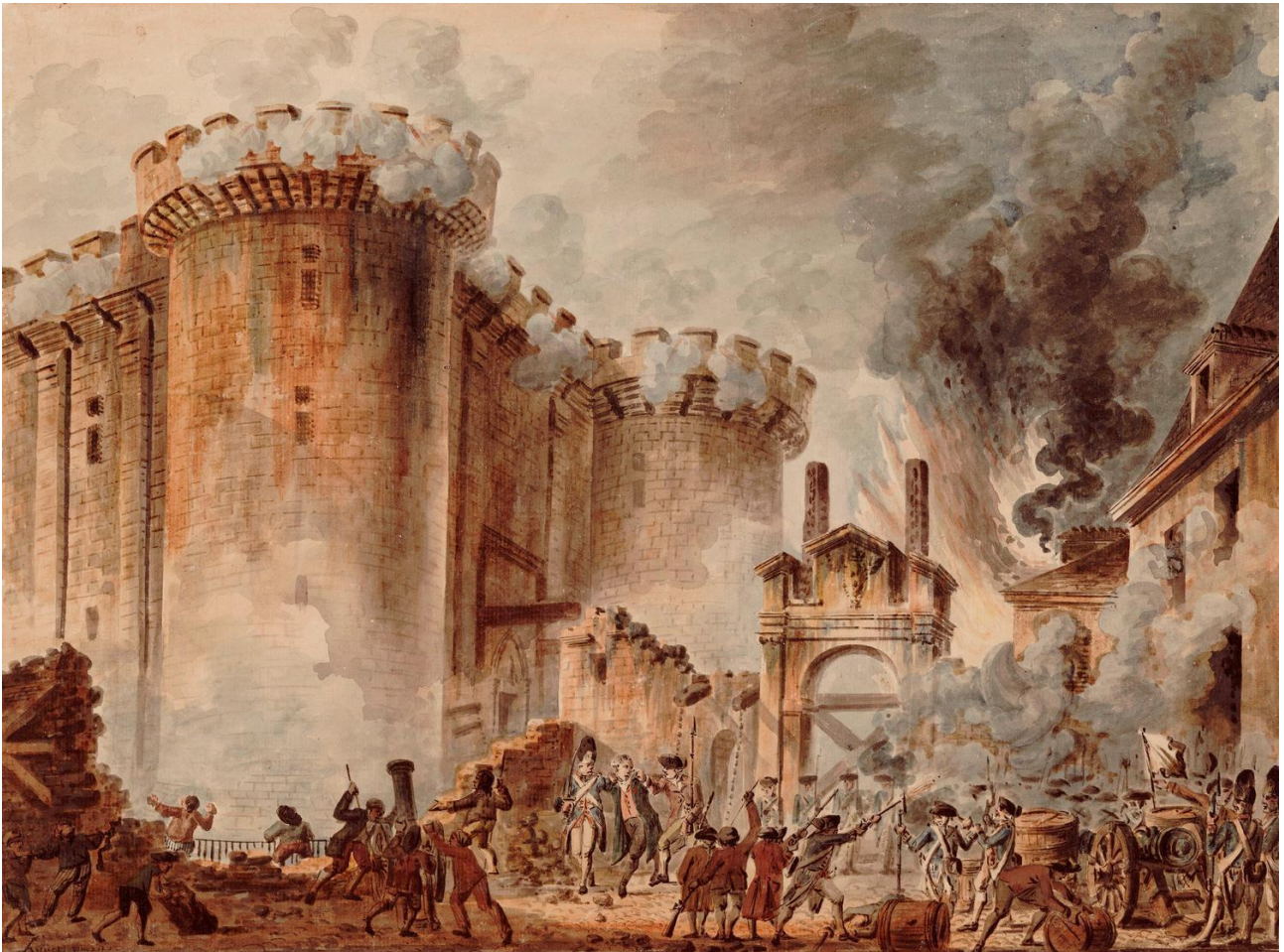
Maleri: Jean-Pierre Houël/Bibliothèque Nationale de France

(Politiken Historie | 29. nov. 2023 | 35:55)