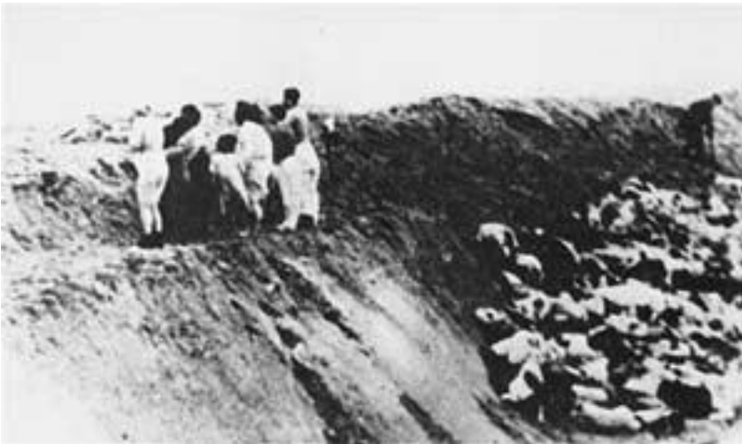
Jødiske kvinder masselikvideres af lettisk SD og politi, dec. 1941.