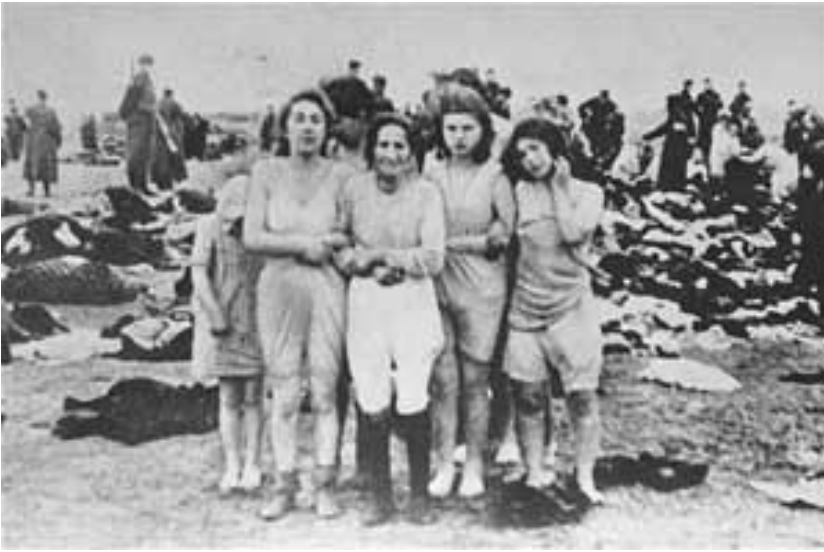
Afklædte jødiske kvinder før de nedskydes på en strand i Liepaja, Letland af Letlands SD (sikkerhedstjeneste) og politi d. 15. dec. 1941.