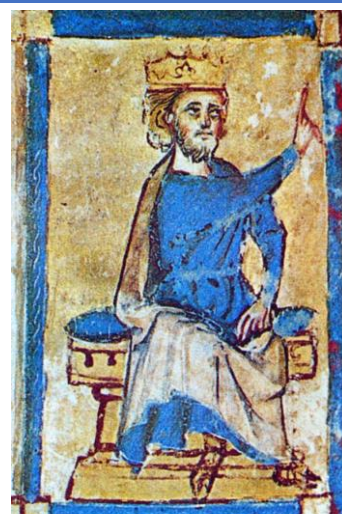
Erik 5. Klipping afbildet i et håndskrift fra ca. 1282

Herunder bringes et uddrag på nudansk af Erik Klippings håndfæstning