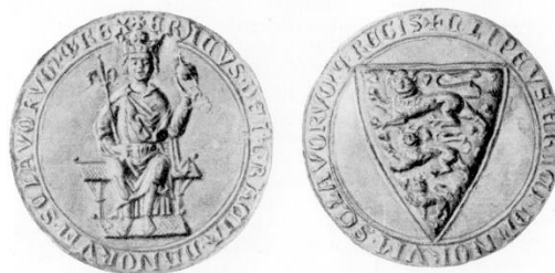
Erik Klippings segl