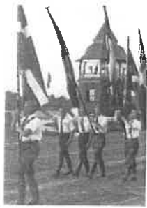
KU marcherer på travbanen i Charlottenlund i 1933.