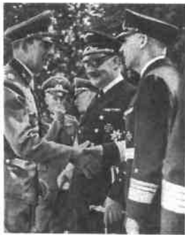
General Lüdtke (t.v.) hilser på den tyske marinechef i Danmark. I midten rigsbefuldmægtigede von Renthe-Fink.

Den væsentligste undtagelse med hensyn til besættelseordningen var det militære område, hvor den tyske øverstbefalende i Danmark kunne træde i direkte forbindelse med de danske myndigheder. I takt med krigens udvikling betragtedes flere og flere sager som militære anliggender, og den tyske militære øverstbefalende i Danmark skabte sig derved en selvstændig magtposition.