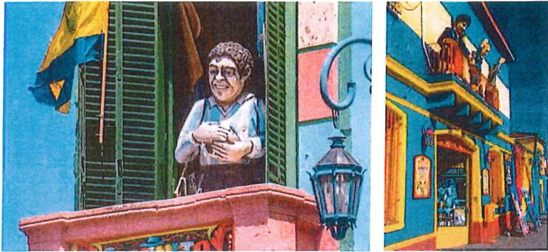
FOTO 1 - Maradona-figur, Buenos Aires, Argentina