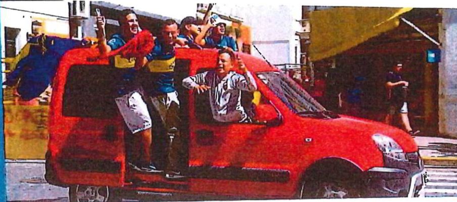
Boca Junior fans fejrer sejren