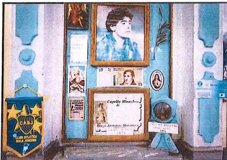
Alter i de argentinske farver og prydet med katolske figurer til tilbedelse af Maradona i Napoli, Italien

I la Iglesia Maradoniana er Diego Maradona guden, som ophøjes og tilbedes. Kirken blev stiftet i 1998 i Rosario-regionen i Argentina og har i dag omkring en halv million tilhængere på verdensplan. Navnlig i Maradonas hjemland, Argentina, findes mange af kirkens tilhængere, men også i Italien, hvor store dele af Maradonas karriere udspillede sig, særligt i byen Napoli, dyrkes fodboldikonet som en gud - og det på trods af de mange narkorelaterede skandaler, som Maradona efter karrierens ophør også har været forbundet med.