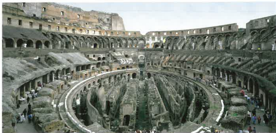
Det indre af Colosseum i Rom, bygget ca. 70-80 e.Kr.