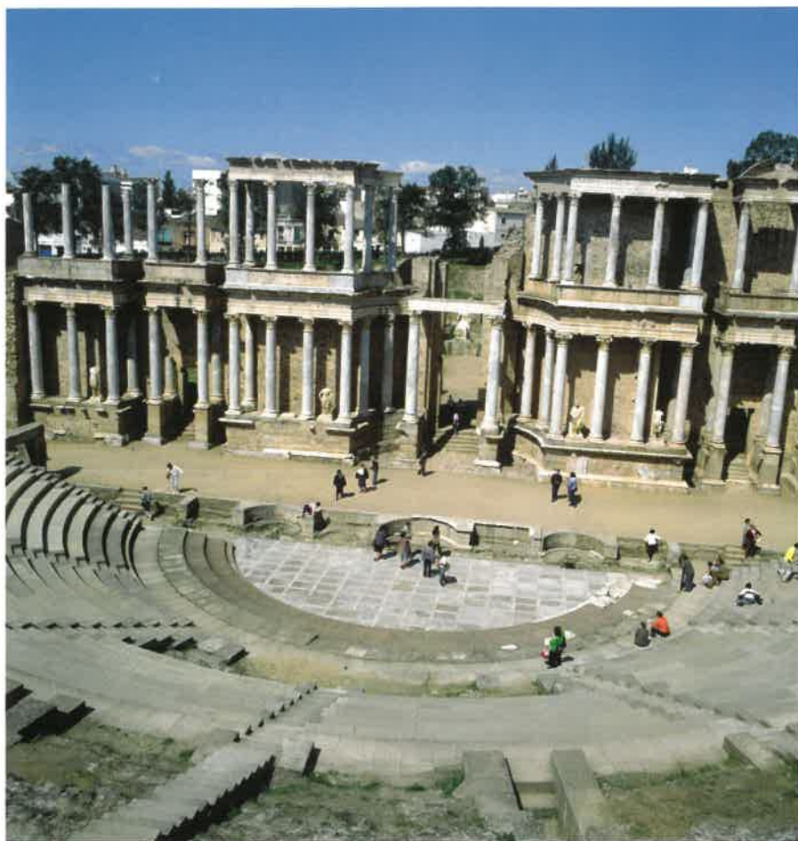
Et vue ned over scenen i teateret i Merida, Spanien.