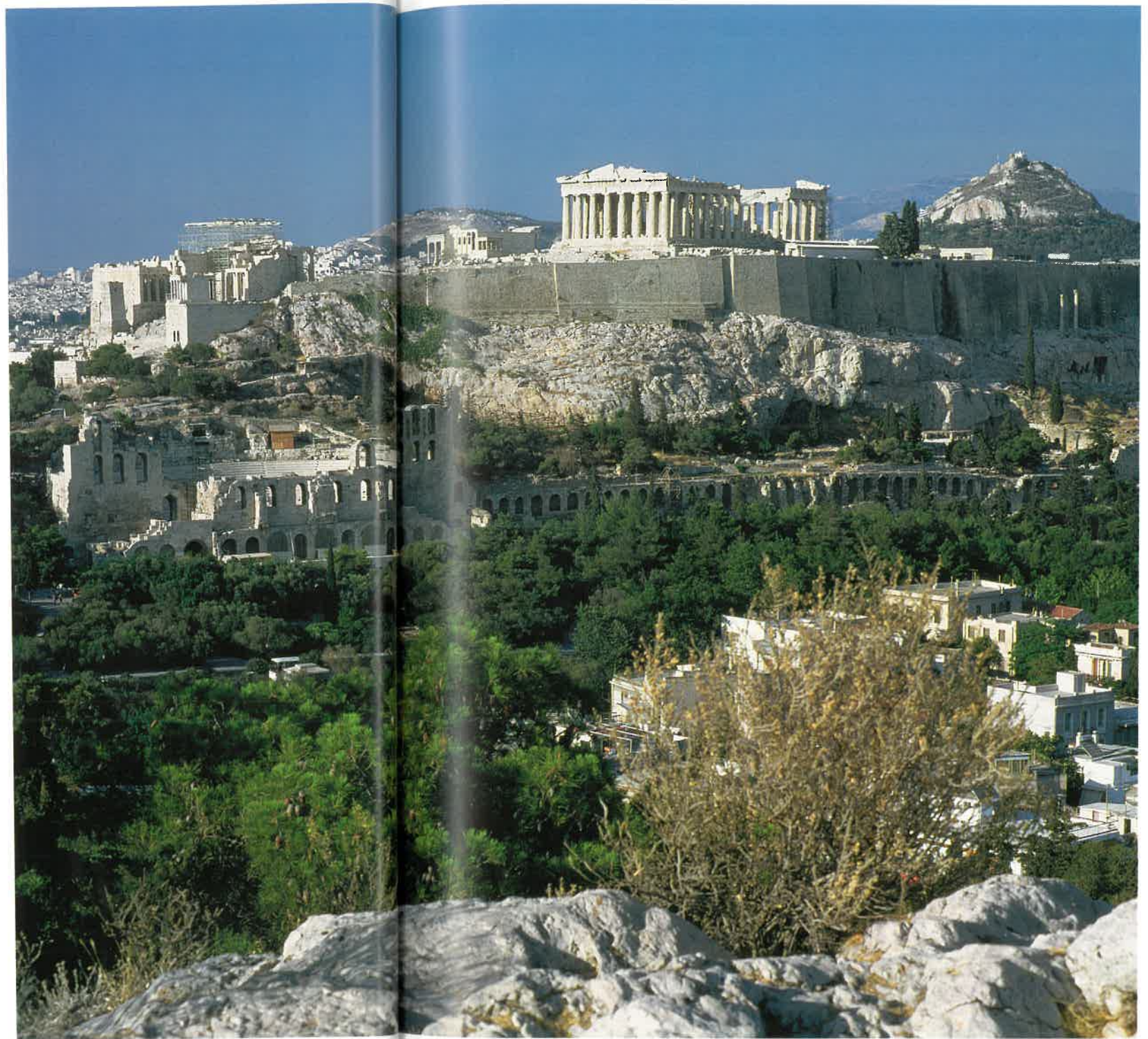
I baggrunden ses Parthenontemplet på Athens akropolis.

Kunne man spørge nogle af alle disse mennesker, hvilke forventninger de havde til livet og fremtiden, ville man naturligvis få mange forskel-