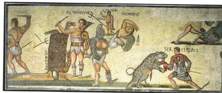
Gladiatoren i kamp.

stykker af alt lige fra de store græske tragedieskrivere og romerske komedieskrivere til de mest platte og halvpornografiske stykker. Men den mest yndede fornøjelse var dog i at gå i Circus. Medens amfiteatret var ellipseformet og domineret af den store sanddækkede arena (arena betyder sand på latin), var Circus normalt en aflang hestevæddeløbsbane, hvor forskellige hold dystede indbyrdes. Teatret var et halvt amfiteater, hvor scenen lå i midten.