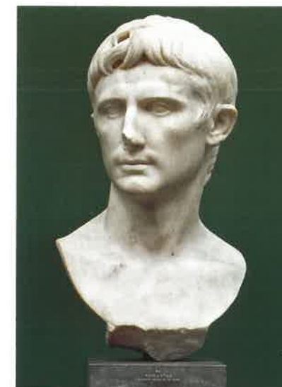
Den unge Augustus.