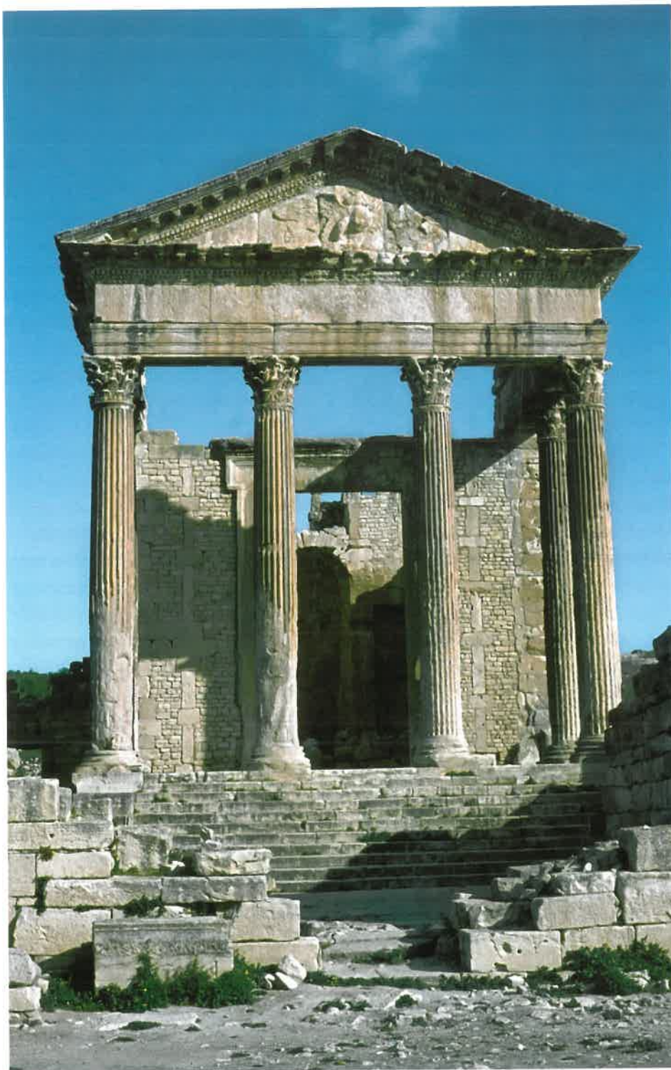
Capitolium i Dougga, Tunesien.

folkeforsamlingsmøder, senatssamlinger, forestillinger i amfiteatret, valg og krigserklæringer spurgte man guderne til råds. De antikke kalendere var spækket med religiøse festdage, og det var uhyre vigtigt at gennemføre de foreskrevne ritualer meget nøjagtigt. Ellers var handlingen ugyldig, og det, man havde foresat sig, ville gå galt. Gennem embedsmændene og særlige præsteskræber etablerede det offentlige et næsten kontraktlignende forhold mellem guder og mennesker, som skulle sikre gudernes støtte. Guderne og dyrkelsen af dem var således samfundets fundament og gav det sammenhængskraft. Derfor kan politik og religion ikke adskilles i antikken.