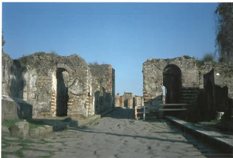
Gadebillede fra Pompeii.

daglige – vej gennem de store offentlige badeanlæg. Sidde ved siden af dem, når de besøgte en af de få læger eller kvaksalvere i buegangene omkring badeanlæggets udendørs swimmingpool eller blot slappede af til oplæsning af store kunstners værker. Det kunne være græske klassikere eller berømte historiske værker som fx Livius' "Roms historie", digteren Vergils værk om Roms grundlæggelse eller digtere som Horats og Ovid. På festdage kan vi følge dem i teatret og i amfiteatret. Alle disse fornøjelser var et vigtigt led i den kontrol med befolkningen, som var nødvendig især i de større byer.