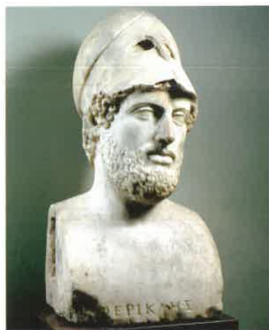
Buste af Perikles. Romersk marmorkopi af den græske original, som var opstillet på Athens akropolis.

Både grækere og romere mente, at den store og stærke personlighed havde en afgørende indflydelse på historiens gang. I den græske verden udbyggede Perikles (495-429 f.Kr.) det athenske demokrati og havde som strateg, dvs. leder af militærvæsenet, i perioder stor indflydelse på Athens udvikling mod et imperium og i opgøret med Sparta i den peloponnesiske krig. Han døde antageligt af pest i 429, men var kort før sin død blevet kritiseret voldsomt for sin meget defensive strategi over for spartanerne og idømt en bøde. Perikles var en fremragende taler og feltherre og færdedes gerne blandt tidens filosoffer og kunstnere.