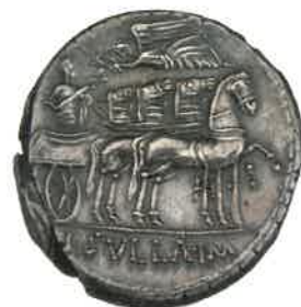
Lucius Cornelius Sulla i triumfvogn, mens han krones af en flyvende Victoria, sejrsgudinde.

I år 60 f.Kr. havde Cæsar sikret sig kontrollen med det romerske politiske system gennem en uformel alliance med den rige Crassus og den populære Pompeius. Denne alliance sikrede Cæsar kommandoen over