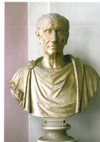
Buste af Julius Cæsar.

Augustus' system, som man siden har kaldt principatet, formåede på samme tid at tilfredsstille den romerske adels ønsker om embeder og ære, at afslutte en næsten 100 års periode med borgerkrige og gennem en række administrative reformer at sikre den så berømmede romerske fred, pax romana, for hele imperiet.