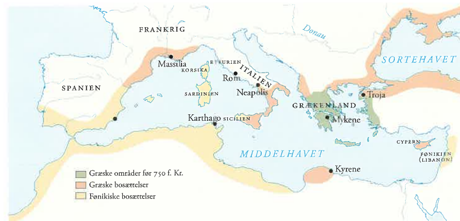
Middelhavet og Sortehavet med græske og fønikiske kolonier.

I det 8. årh. f.Kr. var en lang række bystater vokset frem på den græske halvø og Lilleasiens kyst. Fra disse byer udgik de følgende århundreder