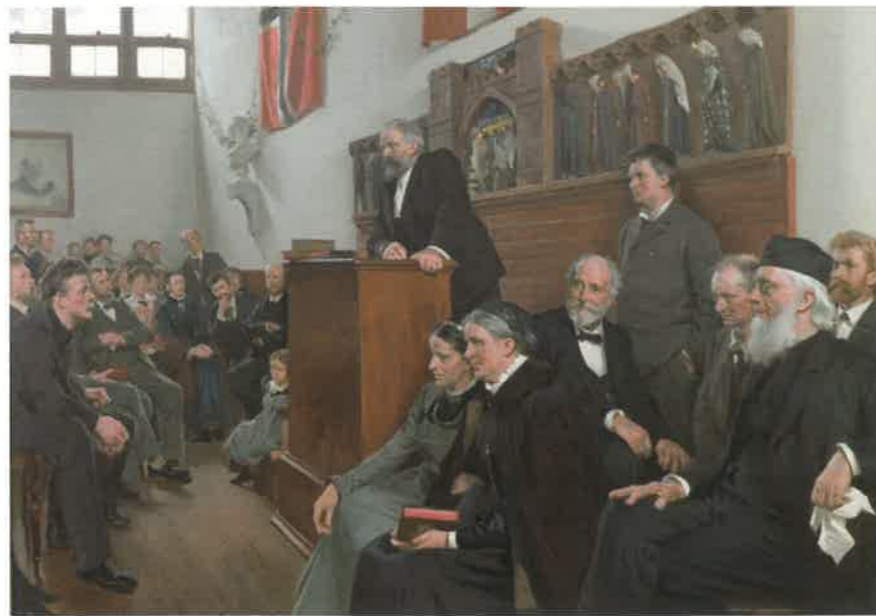
▲ Foredrag på Askov højskole, hvor emnerne var nationale, religiøse og almenmenneskelige emner. På billedet ses skolens lærere og elever, og på væggen hænger et billede af N.F.S. Grundtvig (1783-1872), der var en af initiativtagerne til højskolebevægelsen.