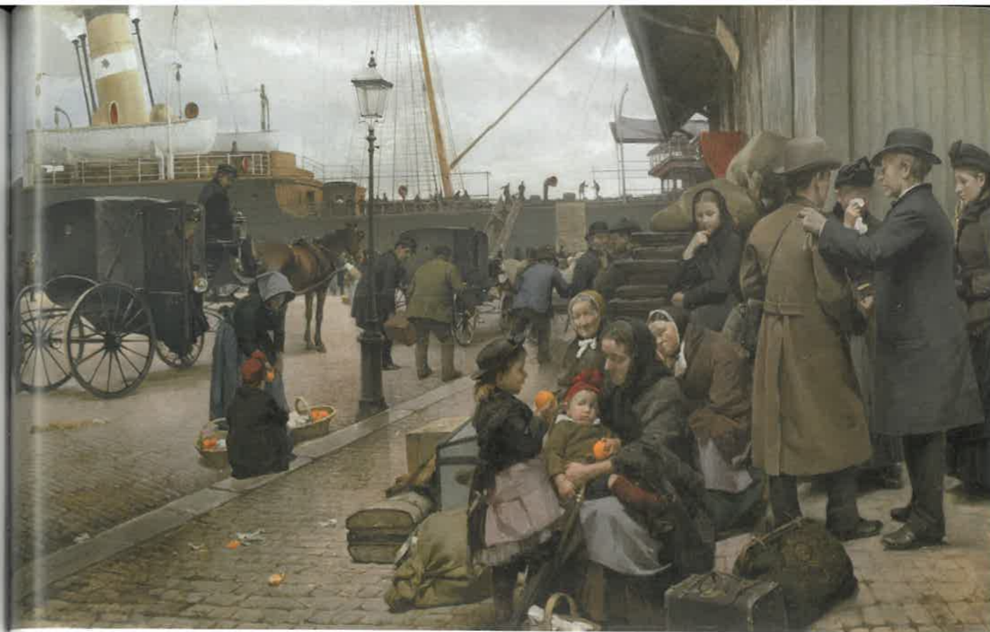
▲ Maleriet "Udvandrerne på Larsens Plads" (1890) viser en gruppe mennesker på Københavns havn inden afrejsen til Amerika. Maleren Edvard Petersen skildrede især arbejdernes liv.

Kilde: Dansk socialhistorie, bind 5, side 91.