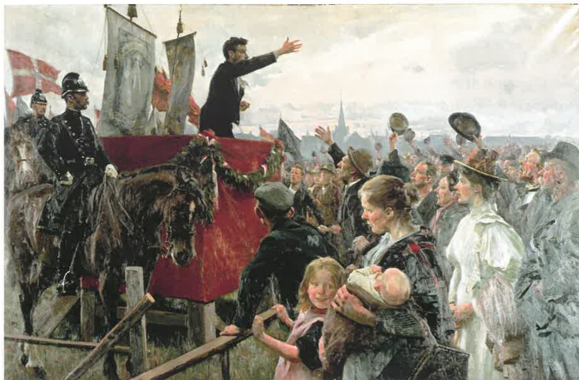
▲ Erik Henningsen: En agitator (1899). Billedet viser et af arbejderbevægelsens møder på Fælleden i København.