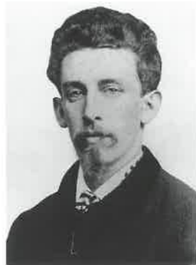
▼ Louis Pio (1841-1894).

Det var vanskeligere for Socialdemokratiet at få politisk indflydelse, og partiet fik sit første mandat i Folketinget i 1882, takket være et valgsamarbejde med Venstre, der ikke stillede op i byerne. Sammen med Socialdemokratiet kunne Venstre stikke en kæp i hjulet på deres politiske hovedmodstandere i Højre. Logikken var, at Venstre hellere så en socialdemokrat i Folketinget end en højremand. Socialdemokraterne havde indflydelse på en række love, blandt andet sygekasseloven i 1892 og en lov om alderdomsforsorg i 1902, men partiets gennemslagskraft kom først efter første verdenskrig (1914-1918). Det skal vi se nærmere på i næste kapitel.