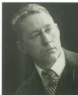
▼ Johannes V. Jensen (1873-1950).

Begejstringen for den teknologiske udvikling og de naturvidenskabelige fremskridt blev lovprist af mange, og perioden cirka 1880 til 1914 gennemstrømmedes af en kolossal teknologioptimisme. En af dem, der lovpriste fremskridtet, var den danske forfatter Johannes V. Jensen, som det fremgår af kilde 47, der er fra 1901.