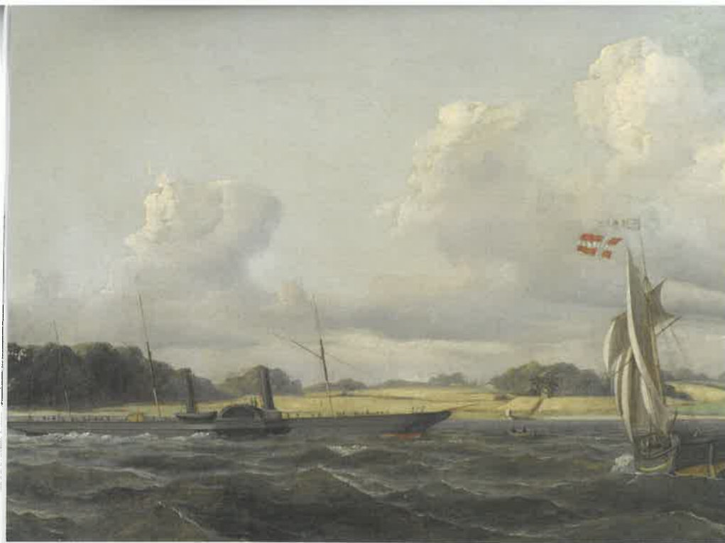
▲ Dampskibet Zampa af København. Maleri af Carl Olsen, 1856.