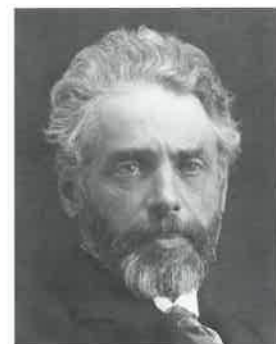
▲ Henrik Pontoppidan (1857-1943).

Omlægningen betød, at der over hele landet i 1880'erne skød mejerier og slagterier op, der kunne forarbejde landbrugsprodukterne til smør, ost og bacon. I stedet for at dyrke korn til eksport blev kornet nu i højere grad brugt som foder til dyrene. Omlægningen viste sig at være en klog beslutning, fordi efterspørgslen på forarbejdede landbrugsvarer var stabile eller svagt stigende.