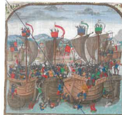
◀ Tv.: Søslaget ved Sluys i 1340, hvor englænderne besejrede den franske flåde i et typisk middelalderligt søslag, hvor skibene var jaget fast til hinanden, og soldaterne entrede hin andens skibe og kæmpede mand til mand på dækkene.

Det var ufatteligt kostbart for englænderne at holde en hær i felten i Frankrig med lange forsyningslinjer og med smitsomme sygdomme,