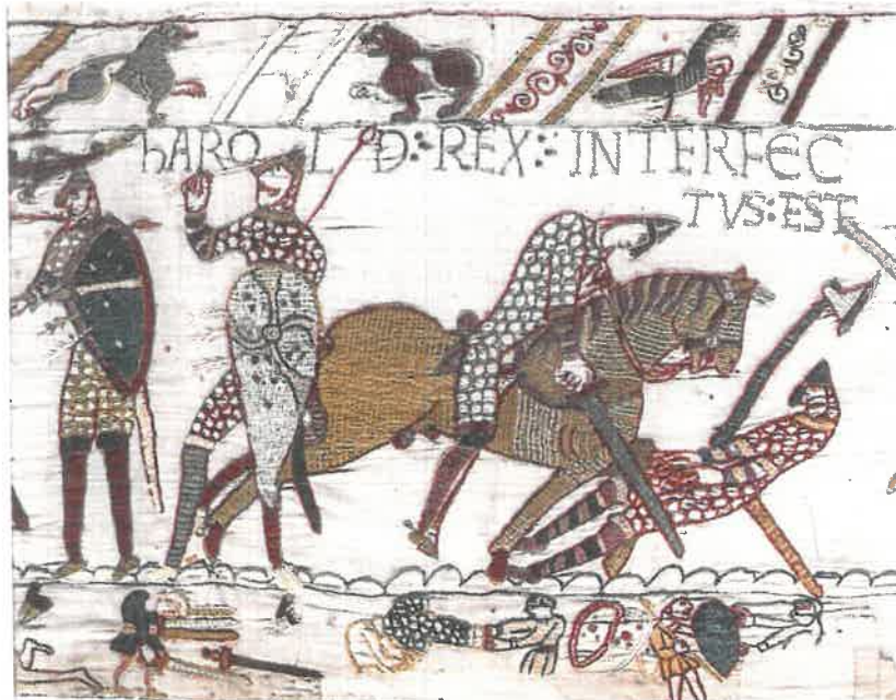
▲ Udsnit af Bayeux-tapetet der viser normannerne, som på hesteryg angriber de forsvarende angelsaksiske soldater. Den latinske tekst siger: "Her dræbes kong Harold." Angelsakserne kæmpede til fods, normannerne til hest og med bueskytter.

danske og norske konger og hertug Vilhelm fra Normandiet i Frankrig gjorde krav på kongemagten.