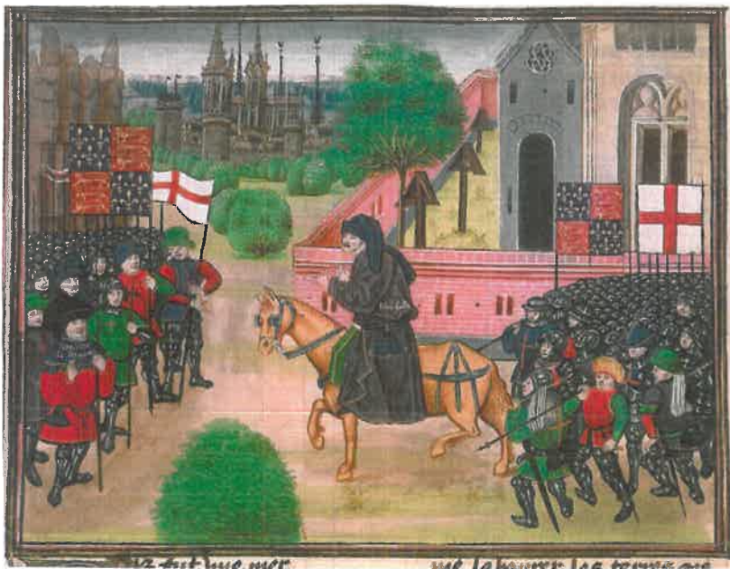
▲ En illustration fra cirka 1470, der viser John Ball (i midten til hest), en oprørske præst, der prædiker for de engelske oprørere i 1381, anført af Wat Tyler (forrest til venstre i rød dragt). Kilderne citerer John Ball for den berømte sætning: "Da Adam pløjede og Eva spandt, hvem var da en herremand?" Flagene er dels det engelske flag (rødt kors på hvid bund), dels Plantagenet kongernes banner (med de engelske løver og de franske liljer): Oprørerne insisterede på at være kongetro. Illustration fra 1400-tallet fra Jean Froissarts Chroniques.

generelle utilfredshed med deres lønninger og vilkår og livegne bønders utilfredshed med deres ufrihed. Oprørerne besatte London i to dage og myrdede ærkebiskoppen af Canterbury og fremmede håndværkere. Oprøret blev neutraliseret med tomme løfter og lederne myrdet. Den bestående samfundsorden overlevede, men var midlertidigt rystet.