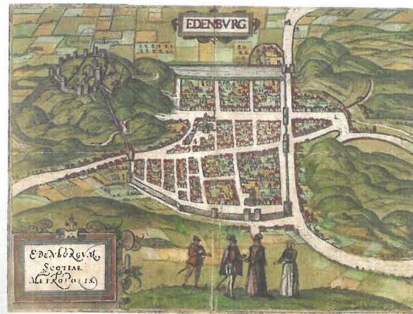
▲ Edinburgh i Braun & Hogenbergs "Civitates orbis terrarum" 1581 efter et træsnit i Raphael Holinsheds "Chronicle" fra 1574. Til venstre Edinburgh Castle, til højre Holyrood Palace under bjergets Arthur's Seat. Imellem de to bygninger ligger Edinburghs hovedgade, High Street ("The Royal Mile") med St. Giles-katedralen. Den middelalderlige bymur med byporte og tårne omkranser byen.

Skotland fik fra 1326 et parlament ligesom England med deltagelse fra højadel, lavadel og borgerskab. Samfundsformen i det engelsktalende lavland lignede det feudale samfunds-