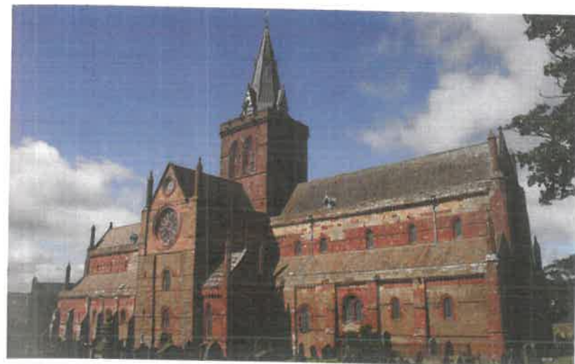
▲ Orkney- og Shetlandsøerne var blevet bosat af norske vikinger og var under norsk-dansk overherredømme indtil 1469. Til ind i 1700-tallet talte folk på øerne stadigvæk norn, et skandinavisk sprog, der lignede færøsk. Sankt Magnus-katedralen i Kirkwall på Orkney står som et minde om den norske tid. Den norske jarl af Orkney og Shetland, Ragnvald den Hellige, startede byggeriet i 1137, men kirken stod først færdig efter cirka 300 år. Kirken er indviet til Ragnvalds onkel Magnus Erlendsson, der også havde været jarl på øerne, men var blevet myrdet i 1115 og bagefter helgenkåret af den katolske kirke.

1282 og sat op over porten til Tower. Erobringen blev sikret med en række store engelske borge. Uden om disse voksede der nye byer op, og pengeøkonomi og engelsk lovgivning spredtes gradvist. Wales blev dog ikke styret som en enhed, og der var ofte oprør og uro.