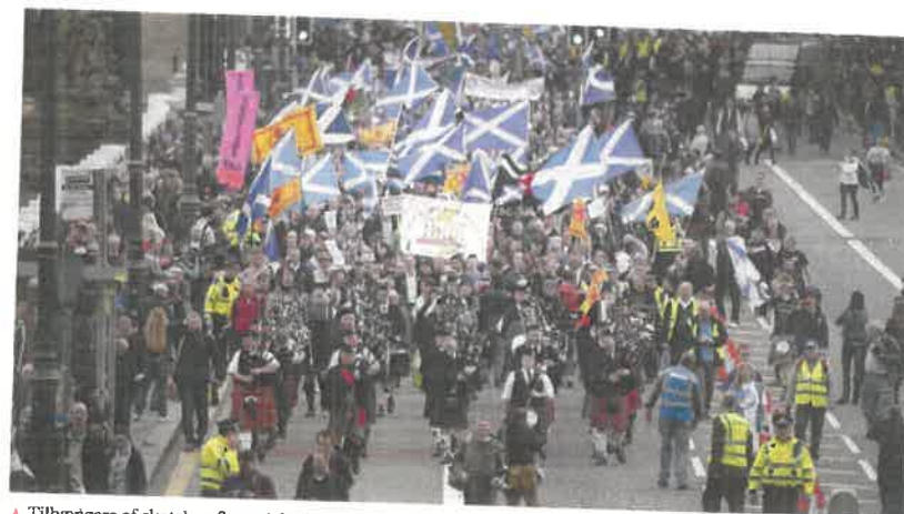
▲ Tilhængere af skotsk uafhængighed marcherer i Edinburgh 21. september 2013 med kiltklædte sækkepibe- og trommespillere i spidsen og med bannere og skotske flag: det skotske kongeflag med en rød løve på gul bund og det skotske nationalflag med Sankt Andreas-korset på blå bund. Midt i demonstrationstøget ses også et walisisk flag: den røde drage over et grønt og et hvidt felt.

Efter valgsejren i 2011 fik SNP udskrevet en folkeafstemning om fuld skotsk selvstændighed i 2014. Mottoet for modstanderne af selvstændighed var ”stronger together”. Resultatet blev 55,3 procent nej mod 44,7 procent ja til selvstændighed. Det var et tæt løb, og i valgkampens sidste dage lovede de britiske