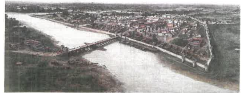
▲ London/Londinium i romertiden. Maleri fra 1753.

Angelsakserne var hedninge, der dyrkede guder som Woden og Thunor (svarende til Odin og Thor i Norden) og fortrængte den