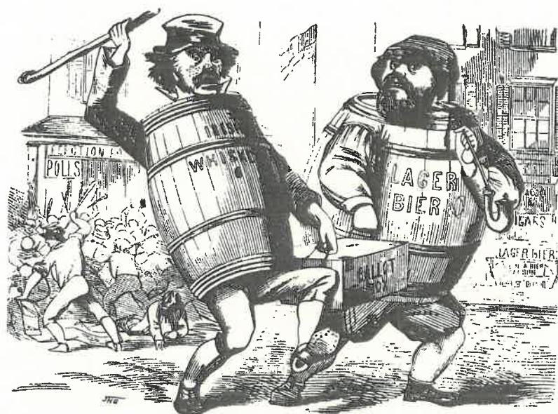
Indvandrerfjendsk satirisk tegning fra 1850'erne viser en whiskey-drikkende irer og en ødrikkende tysker stikke af med valgurnen, mens deres landsmænd laver optøjer i baggrunden.

Fra Israel Zangwills skuespil The Melting Pot , 1908.