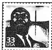
Malcolm X (øverst.) og Martin Luther King, Jr. er begge portrætteret i en serie frimærker, som det amerikanske postvæsen har udgivet, med afro-amerikansk historie som tema.