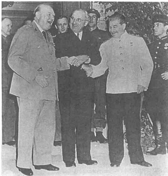
Så gode venner var de vist ... ikke. Winston Churchill, Harry S. Truman og Josef Stalin under Potsdam-konferencen i juli 1945.

Hvad skal der til for at blive en supermagt?