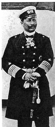
Den tyske Kejsers Wilhelm II i flådeuniform, 1910.

Dermed var det europæiske kontinent kastet ud i en krig, der kom til at vare fire år og tre måneder. Den kostede millioner af mennesker – mest unge mænd – livet. Den bragte undergang til tre kejserriger: Det tyske, det russiske og det østrig-ungarske. Den muliggjorde den kommunistiske revolution i Rusland i 1917. Og den førte til en mærkbar svækkelse af Europas dominerende stilling i verden.