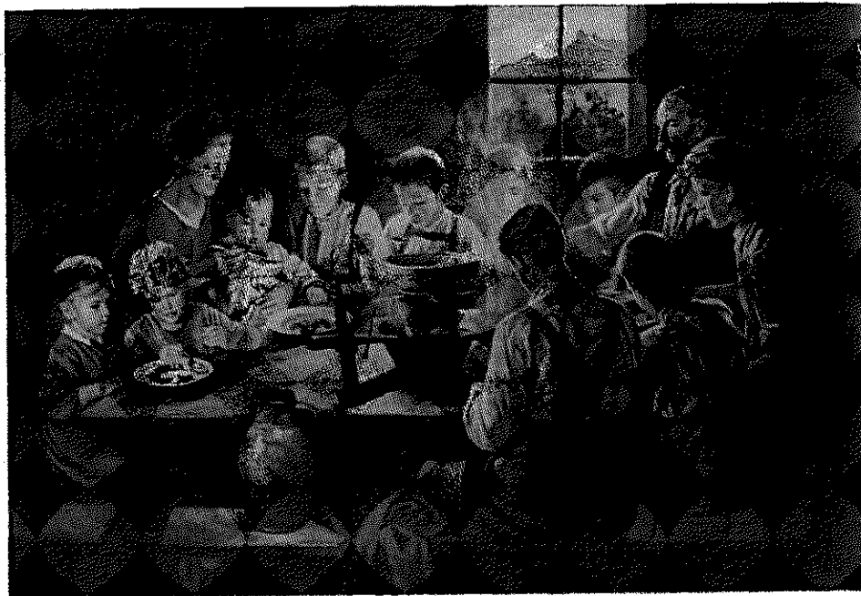
Nazismen dyrkede forestillingen om det oprindelige liv på gården. Ideen var at vise det tyske folks sjælelige og fysiske kraft. "Tysk bjergbondefamilie". Maleri af Rudolf Otto Bech, 1944.

udrydde jøderne i Europa, og den var grundlag for naziregimets ønske om at skabe tyskerne "lebensraum" i Østeuropa på de racemæssigt underlegne slavers bekostning. I nazisternes kamp for at nå regeringsmagten var agitationen mod jøderne et fremragende middel. Den kunne profitere af en traditionel antisemitisme, og den skabte en syndebug, der kunne samle al utilfredshed og frustration.