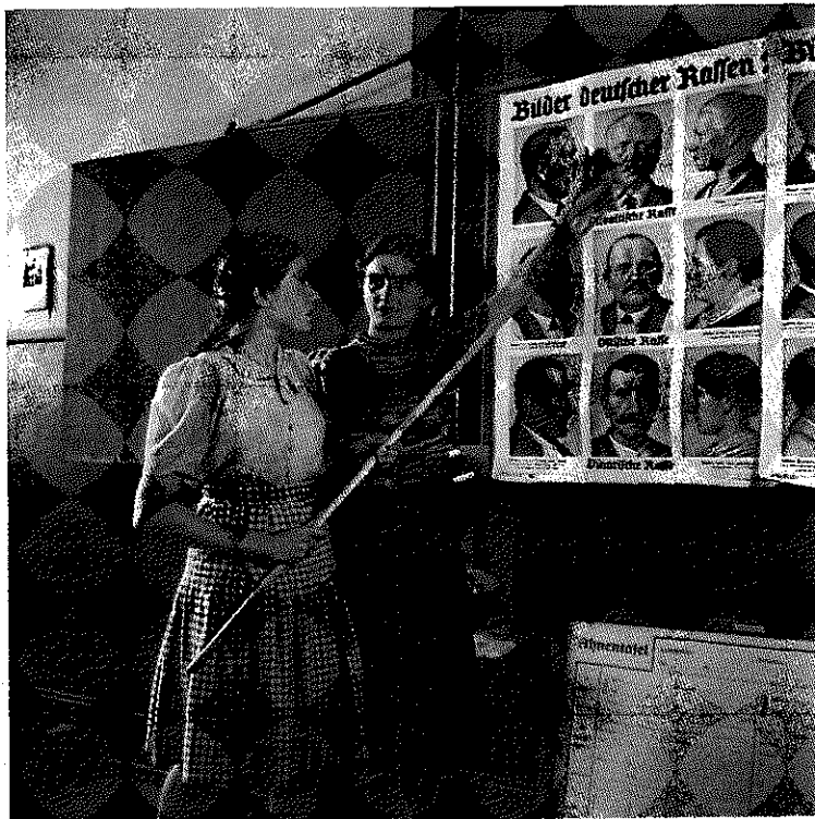
Raceundervisning i en tysk skole, 1943.