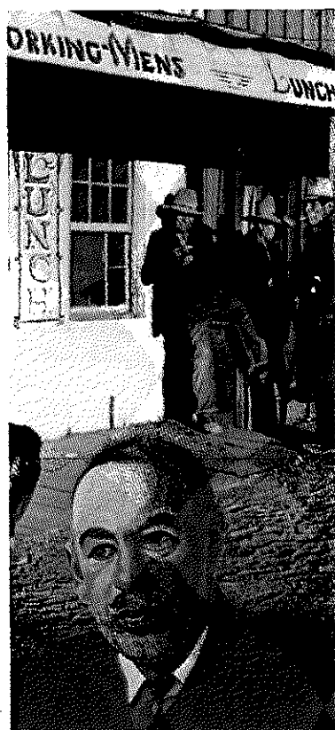
Collage med den engelske økonom John Maynard Keynes i forgrunden.

sig bemærket med sin kritik af omfanget af de tyske erstatningsbetalinger efter Første Verdenskrig, mente, at staten i perioder med arbejdsløshed og lav vækst skulle give flere penge ud, end den opkrævede i skat for derigennem at øge efterspørgslen i samfundet. Staten skulle så låne for at dække underskuddet. Tilsvarende skulle staten i tider med stor efterspørgsel og lav arbejdsløshed holde igen ved at lave overskud på statens regnskab og dermed trække penge ud af samfundet og dæmpe efterspørgslen.