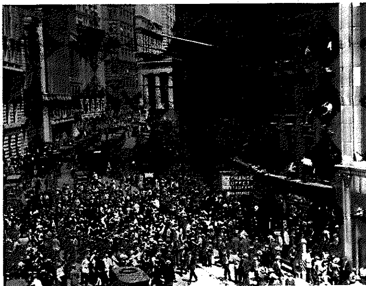
På "Den sorte torsdag", den 24. oktober 1929, krakkede børsen i New York. Bekymrede aktieejere foran børsbygningen i Wall Street.

I USA var der slet ikke grobund for autoritære nationale strømninger, formentlig fordi USA som indvandringsland var etnisk sammensat og uden europæernes historiske nationalitetsbegreb. Den amerikanske nationalisme var i stedet båret af politiske idéer om individernes frihed og ligestilling, idéer der havde ligget bag den amerikanske uafhængighedserklæring tilbage i 1776. Amerikansk nationalisme byggede på forestillingen om, at amerikanerne gen-