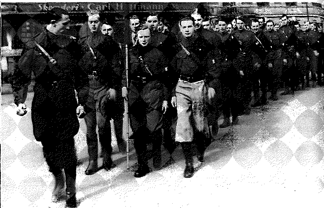
Konservativ ungdom efterlignede nazismens ceremonier, men den slags var kun krusninger på overfladen. København 1933.

var imidlertid krusninger af ringe betydning. Der kunne ikke med nogen troværdighed peges på en kommunistisk trussel i Danmark, og landets lidenhed betød, at der ikke var basis for en aggressiv dansk nationalisme.