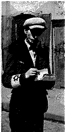
Efter erobringen af Polen i 1939 forflyttede man de polske jøder til overbefolkede ghettoer. Fotograf fra ghettoen i Lublin i det østlige Polen, 1941.

ference nær Berlin (Wansee-konferencen) i januar 1942 drøftede de ansvarlige for jødeproblemet og for de besatte områder i Østeuropa, hvordan man skulle gennemføre den endelige løsning – ”Endlösung” – på jødeproblemet. Herefter blev masse mordet systematisk organiseret. Der oprettedes 6 udryddelseslejre i Polen. Hertil skulle alle europæiske jøder transporteres. De arbejdsdygtige skulle sættes til tvangsarbejde på minimale madrationer og derigennem arbejde sig ihjel – ”Vernichtung durch Arbeit”. De uarbejdsdygtige skulle dræbes i gaskamrene. Ud over jøder blev også sigøjnerne udsat for systematisk folkemord, og også politiske fanger og grupper som f. eks. homoseksuelle og Jehovas Vidner endte i udryddelseslejrene. Alt i alt regner man med, at omkring 6 millioner jøder blev ofre for folkemordet.