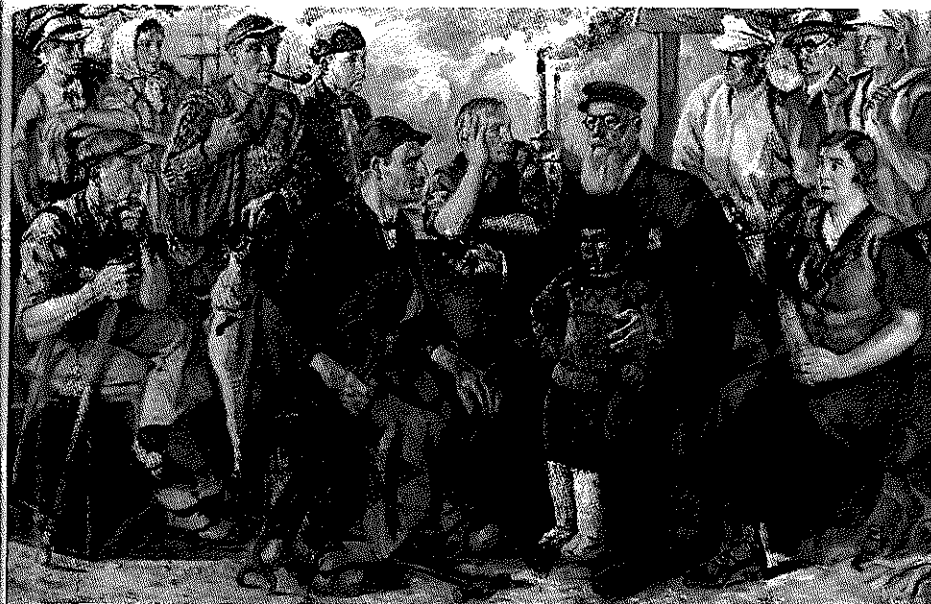
Den socialdemokratiske statsminister Thorvald Stauning blev i 1930'erne en landsfaderlig figur. W. Glud: Alfaderen, 1939.