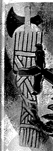
Fasces var det antikke romerske imperiums symbol på magt. Udsnit fra en fascistisk plakate fra 1930'erne.