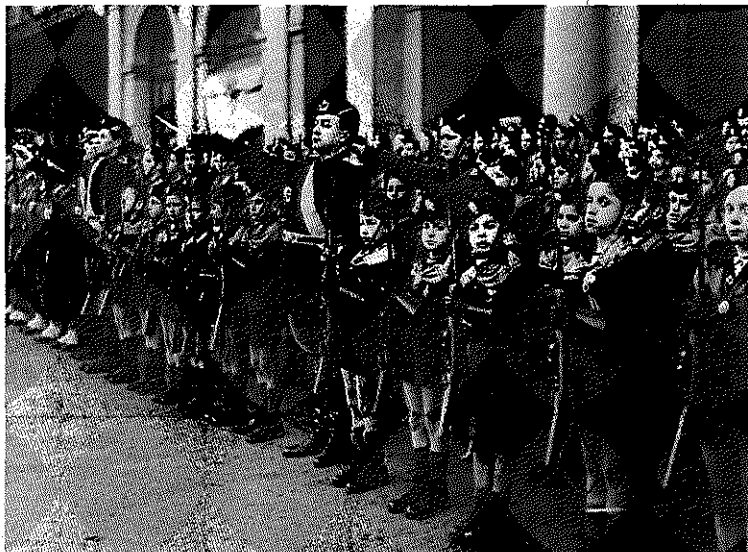
Unge italienske sortskjorter ved en parade i 1930'erne.

(dvs. individer og grupper) har deres plads og funktion, ligesom de enkelte organer har det i en biologisk organisme. At hæfte sig ved sociale forskelle og at tale om klasser er ifølge fascismen at splitte det naturlige, nationale fællesskab.