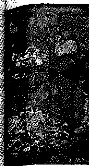
Hyperinflationen i 1923 førte hurtigt til, at tyske pengesedler mistede al værdi. Pengesedler læses i papirkværn som gammelt papir. Foto fra Berlin, 1923.

Den enorme økonomiske omfordeling, der var resultatet af hyperinflationen i 1923, skabte dyb bitterhed hos mange mennesker, en bitterhed som i sidste ende blev rettet mod selve den demokratiske Weimarrepublik.