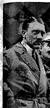
Den 34-årige Hitler på gaden under "De tyske dage" i Nürnberg, 1923.