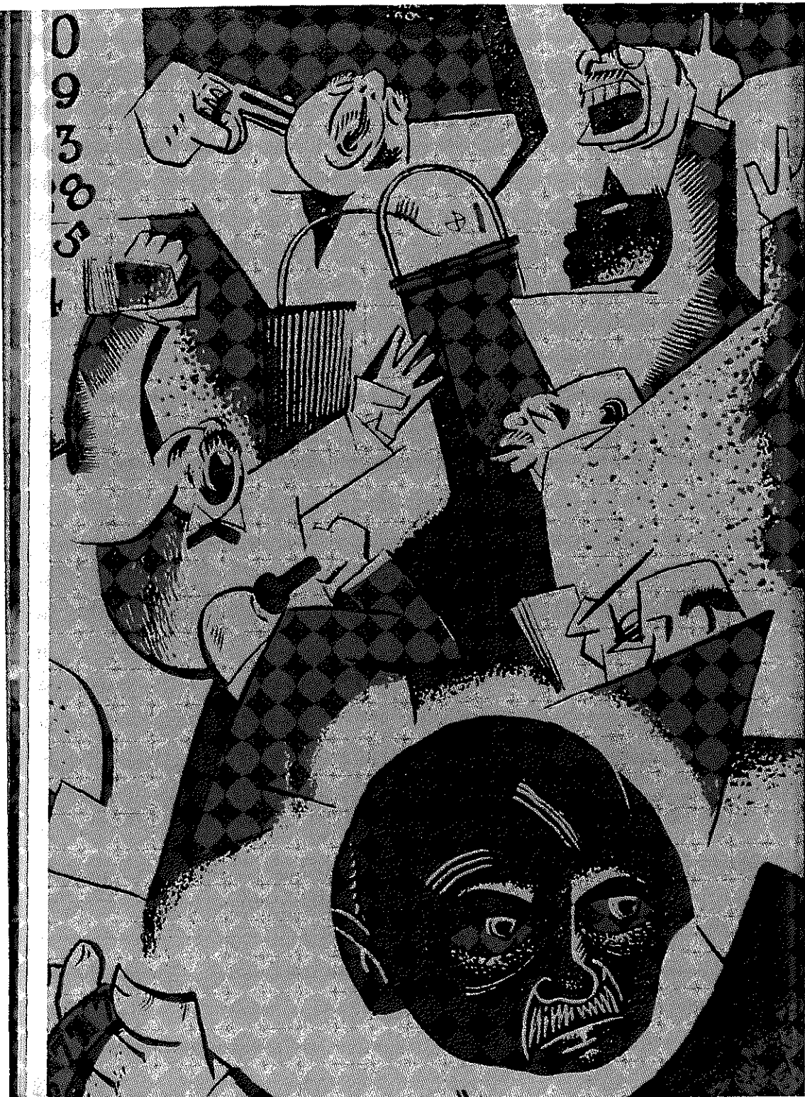
1930'erne var præget af krakket på Wall Street i New York i oktober 1929. "Børsen", tegning af William Gropper.