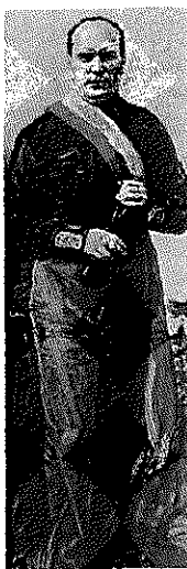
I 1922 etablerede Benito Mussolini et fascistisk diktatur i Italien.