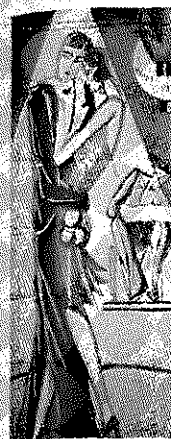
Den optimistiske stemning og den gode økonomi i midten af 1920'erne er baggrunden for betegnelsen: "De brølende tyvere". Udsnit fra et postkort, ca. 1925.

at betale for krigen. De forandringer, der var sket med Europakortet, skærpede de økonomiske problemer, fordi tidligere store, økonomiske enheder som Østrig-Ungarn og det russiske zarrige var afløst af mange mindre stater. Der var nu mange flere told- og valutagrænser, som hæmmede handlen.