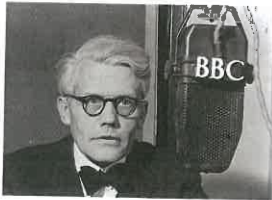
Christmas Møller (1894-1948). Den konservative leder flygtede til England i 1942 og blev her som leder af Det danske Råd i London en nøgleperson i modstandsbevægelsen. Gennem BBC opfordrede han den danske befolkning til aktiv modstand mod besættelsesmagten. Han vendte hjem som helt og blev udenrigsminister i befrielsesregeringen. Mistilliden mellem samarbejdsfolk og modstandsfolk var dog stor, og Christmas Møller kom i et stigende modsætningsforhold til sit parti. Det kom til et brud fremkaldt af det sønderjyske spørgsmål. Borgerlige kredse med Venstres statsminister Knud Kristensen i spidsen ønskede at udnytte stemningen i det nedertagshærgede Tyskland til en ny græserevision. Christmas Møller var stærkt imod, og ved valget i 1947 opstillede han (tilmed i Sønderjylland!) uden for partierne, men blev ikke valgt.

For at bidrage til opretholdelse af mellemfolkelig fred og sikkerhed forpligter alle medlemmer af FN sig til på opfordring af Sikkerhedsrådet og i overensstemmelse