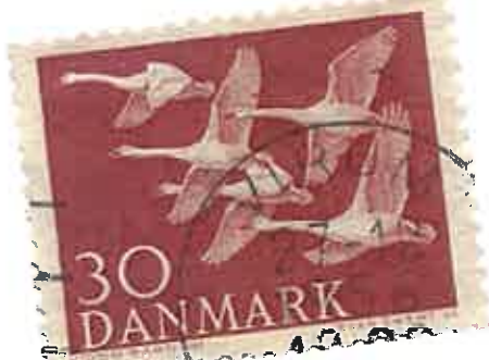
De 5 nordisk svaner – symbolet på nordisk samarbejde – udsendt samtidigt på frimærker i de nordiske lande i 1956. Med Danmarks og Norges deltagelse i NATO gik de nordiske lande hver sin vej på det sikkerhedspolitiske område. Heller ikke på et andet vigtigt område kunne de nordiske lande blive enige om en fælles kurs. Et forslag om en økonomisk union, Nordek, faldt i 1969. Til gengæld udvidedes det nordiske samarbejde på en række andre områder. I 1950 dannedes det skandinaviske luftfartsselskab, SAS. I 1952 stiftedes Nordisk Råd, og dette organ blev i de følgende år et forum for samarbejde om bl.a. arbejdsmarkeds-, social-, sundheds-, uddannelses- og kulturpolitik. Blandt resultaterne kan nævnes et fælles nordisk arbejdsmarked og pasområde. Bag om de højtidelige skåltaler om det historisk-kulturelle nordiske fællesskab var det dog kun få politikere, der for alvor prioriterede det nordisk samarbejde højt.

Da det i begyndelsen af 1949 stod klart, at Norge ville søge optagelse i NATO, henvendte den danske regering sig til Sverige for at undersøge mulighederne for et dansk-svensk forsvarsforbund. Om henvendelsen til Sverige først og fremmest skulle tjene indenrigspolitiske formål – at vise tvivlere inden for bl.a. Socialdemokratiet, at ethvert forsøg på en nordisk løsning var gjort – kan ikke afgøres. I hvert fald var Sverige – forståeligt nok – ikke interesseret i at knytte sin sikkerhed sammen med sin lille militært svage, kontinentaleuropæiske nabo, og den danske regering valgte derfor også at søge optagelse i NATO.