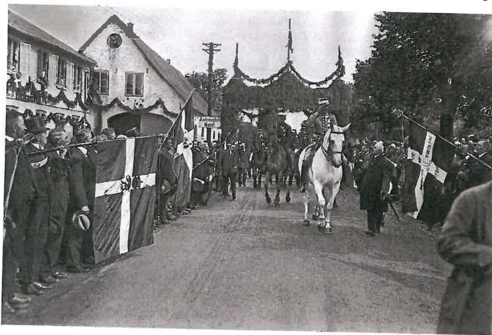
Christian 10. rider over grænsen 10. juli 1920. For dansksindede i Sønderjylland og for mange danskere i kongeriget var det et stort og følelsesladet øjeblik i Danmarkshistorien, som senere tiders danskere kan have svært ved at sætte sig ind i. Henrik Pontoppidan (s.199) satte tekst på følelserne med sangen: "Det lyder som et æventyr, et sagn fra gamle dage: en røvet datter, dybt begrædt, er kommen frelst tilbage!" (2)

Tilpasningspolitikken holdt ikke Danmark ude af 2. Verdenskrig. Den 9. april om morgenen blev Danmark