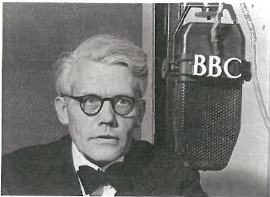
Christmas Møller (1894-1948). Den konservative leder flygtede til England i 1942 og blev her som leder af Det danske Råd i London en nøgleperson i modstandsbevægelsen. Gennem BBC opfordrede han den danske befolkning til aktiv modstand mod besættelsesmagten. Han vendte hjem som helt og blev udenrigsminister i befitelsesregeringen. Mistilliden mellem samarbejdspolitikere og modstandsfolk var dog stor, og Christmas Møller kom i et stigende modsætningsforhold til sit parti. Det kom til et brud fremkaldt af det sønderjyske spørgsmål. Borgerlige kredse med Venstres statsminister Knud Kristensen i spidsen ønskede at udnytte stemningen i det nederlagshærgede Tyskland til en ny grænserevision. Christmas Møller var stærkt imod, og ved valget i 1947 opstillede han (tilmed i Sønderjylland!) uden for partierne, men blev ikke valgt.

givet sit omfattende bidrag til den tyske krigsførelse. Danmark havde for tyskerne været en flødeskumsfront, og ingen steder i Europa havde man levet så godt i perioden som i Danmark. De danske tabstal i "modstandskampen" (henrettede modstandsfolk, forliste søfolk og faldne i kamp) var forrygende små i europæisk sammenhæng, og ganske vist kom mange danskere i koncentrationslejre, men også her fik danskerne positiv særbehandling, og langt de fleste overlevede. Den store hjælpeaktion over for jøderne var slet ikke så imponerende endda. Man havde fået et tysk tip på forhånd, og mange skippere tog sig desuden særdeles godt betalt for at sejle jøderne over til Sverige. Og før krigsudbruddet havde Danmark nægtet at modtage og havde i nogle tilfælde endda returneret flygtende jøder til Nazityskland. Efter krigens afslutning havde Danmark