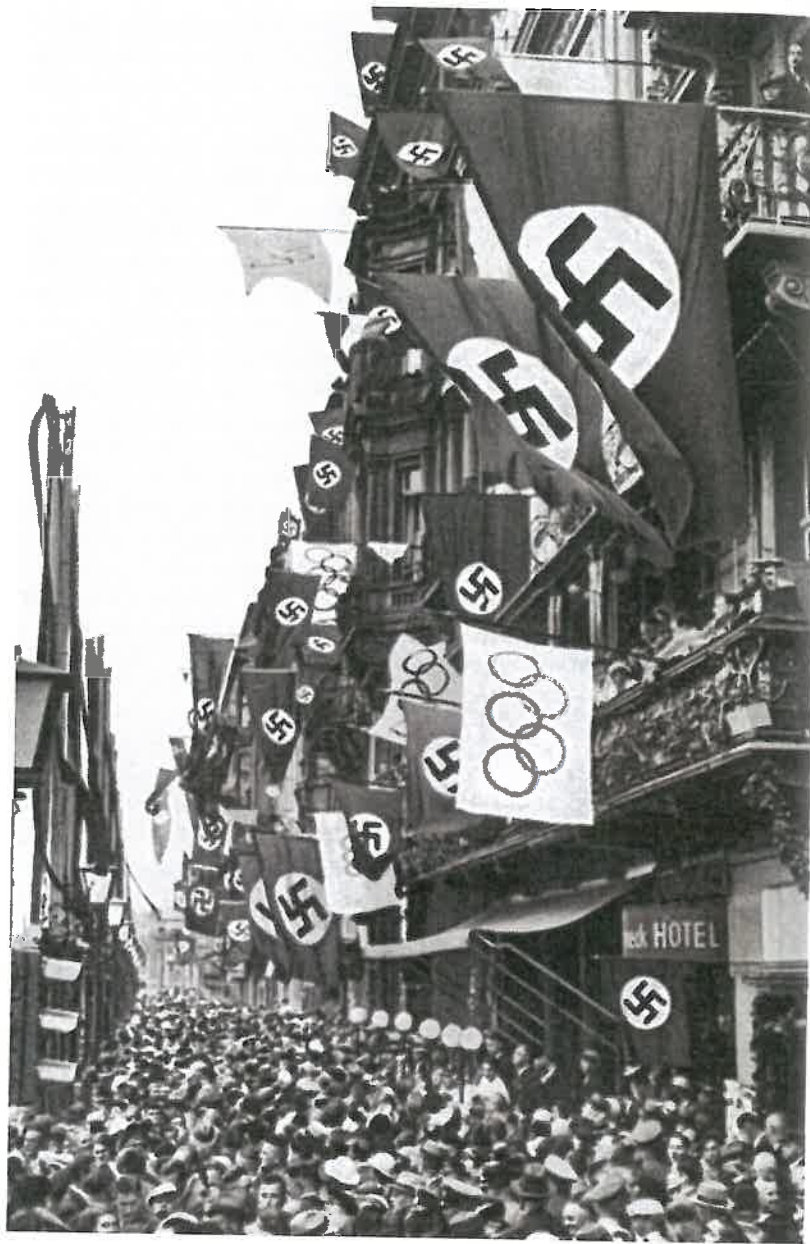
Olympiaden i 1936 var et gigantisk propagandashow iscenesat af nazisterne for at demonstrere det nye Tysklands storhed for verden og for tyskerne. De danske sportsjournalister og sportsudøvere deltog begejstret i showet og videregav begejstringen til den øvrige befolkning. Olympiaden i 1936 var i øvrigt langt fra det eneste eksempel i det 20. århundrede på en tæt forbindelse mellem sport og politik. Op gennem det 20. århundrede og ind i det 21. århundrede skærpedes konkurrencen mellem staterne om de mest imponerende sportsarrangementer og de bedste sportsresultater.

angrebet over land i Sønderjylland, samtidig med at tyske tropper blev landsat fra søsiden i København og tyske bombemaskiner overfløj hovedstaden.