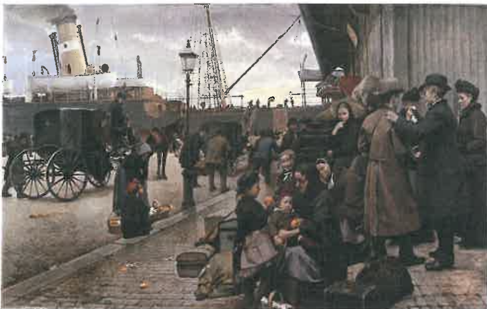
Udvandrere på Larsens Plads i København, maleri af Edvard Petersen 1890 (hænger på Århus Kunstmuseum). Maleren har fanget et afgørende tidspunkt i nogle menneskers liv. Alle broer bagude blev brændt af, når man begav sig ud i det ukendte, og kun dampskibsselskaberne og deres agenter var sikre vindere. Nogle fik dog succes i "de store muligheds land", og "den rige onkel fra Amerika" blev et indslag i mange romaner, noveller og senere også film.