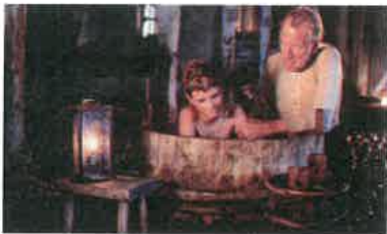
Den indvandrede svenske landarbejder, Lassefor, bader sønnen Pelle i Bille August' filmatisering af Pelle Erobreren. Filmen er en af 12 udpegede film i Kulturkanon. Bille August roses bl.a. for sin evne til at "inddrage naturen som et følsomhedsbarometer for sine personer."