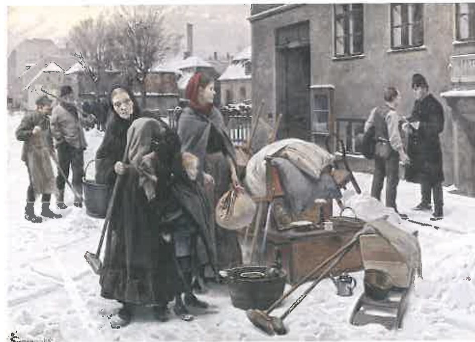
Erik Henningsen: "Sat ud" – maleri fra 1892, der i dag hænger på Statens Museum for Kunst. Når en familie ikke kunne klare sine forpligtelser, var der ingen kære mor. Så var det ud. Til gengæld var det åbenbart et overskueligt projekt at flytte, hvis man ser på mængden af bohøve. Maleriet efterlader imidlertid beskueren med nogle nærliggende spørgsmål: Hvorfor er familien kommet i denne situation? Hvor skal familien tage hen, og hvad vil der videre ske med den? Og hvad har den gamle mor følt ved så åbenlyst at ligge familien til last?

Mens en del af familierne (eller i hvert fald mændene) var med i en sygekasse, var der kun én af de 22 familier, der var med i en aldersforsorgsordning, og ingen af familierne var med i en understøttelseskasse, så de havde et sikkerhedsnet i tilfælde af arbejdsløshed.