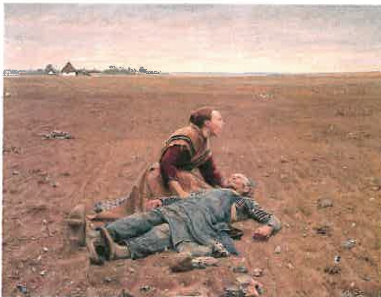
"Udslidt" – maleri af Hans Andersen Brendekilde, 1889. Er det desperation, angst, håbløshed, forladthed, fortvivlelse eller vrede, der afspejler sig i kvindens ansigt? Med motiver som dette trådte også billedkunstnerne ind i samfundsdebatten.