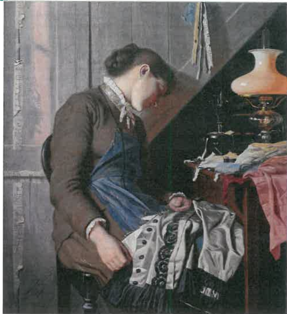
"En sypige - Plinsemorgen" (malet af Wenzel Tornøe 1882 - hænger på Randers Kunstmuseum). Det kunne være nødvendigt at arbejde i døgndrift, når en opgave skulle være færdig til et bestemt tidspunkt.

mælkedreng o.s.v., men der var også stor efterspørgsel efter børn til fabriksarbejde (på grund af den lave løn, omstillingsparathed og de små fingre). Netop dette børnearbejde skulle komme på dagsordenen i 1870'erne (jf. s.227).