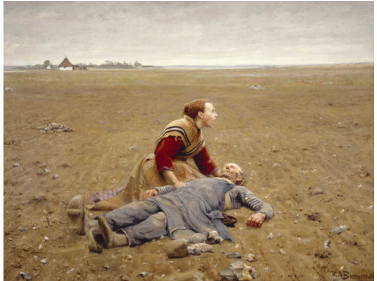
H.A. Brendekilde: "Udslidt", 1889.

Danmark var stadig et bondesamfund i anden halvdel af 1800-tallet. De fleste mennesker boede på landet, og de levede af landbrug. Men der var store forandringer i gang. På landet investerede de store gårdejere i nye moderne maskiner, der gjorde landbrugsproduktionen mere effektiv og billigere. Gårdejerne, dvs. bønderne, tjente store penge. De hyrede landarbejdere, som ikke selv ejede noget, og som ofte levede under usle forhold.