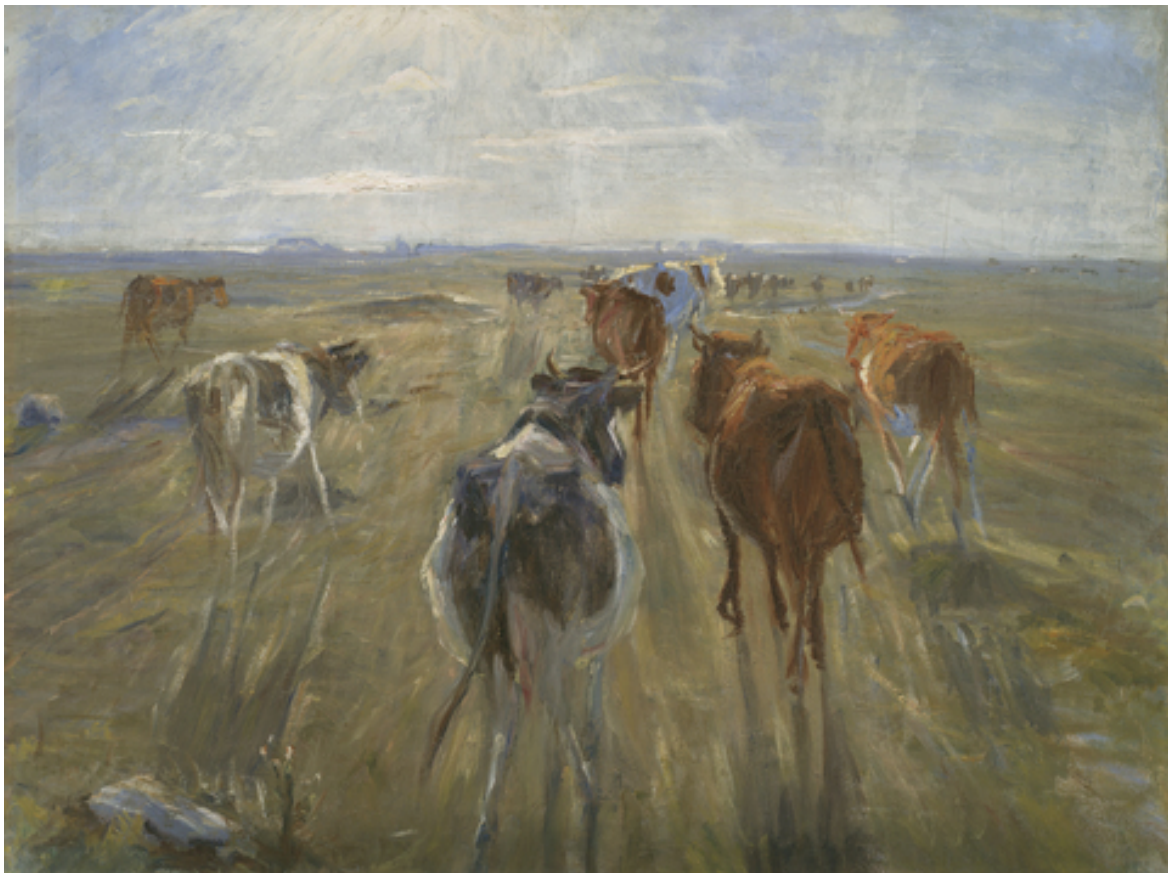
Theodor Philipsen (1840-1920): "Lange skygger. Kvæg på Saltholm", ca. 1890. De franske impressionister inspirerede danske malere og forfattere. På Theodor Philipsens maleri ses penselstrøgene, der får lyset til at vibrere.