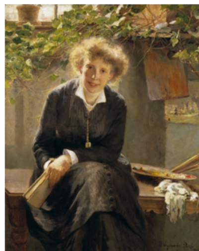
Bertha Wegmann: "Portræt af Jeanna Bauck", 1881 Nationalmuseum, Stockholm