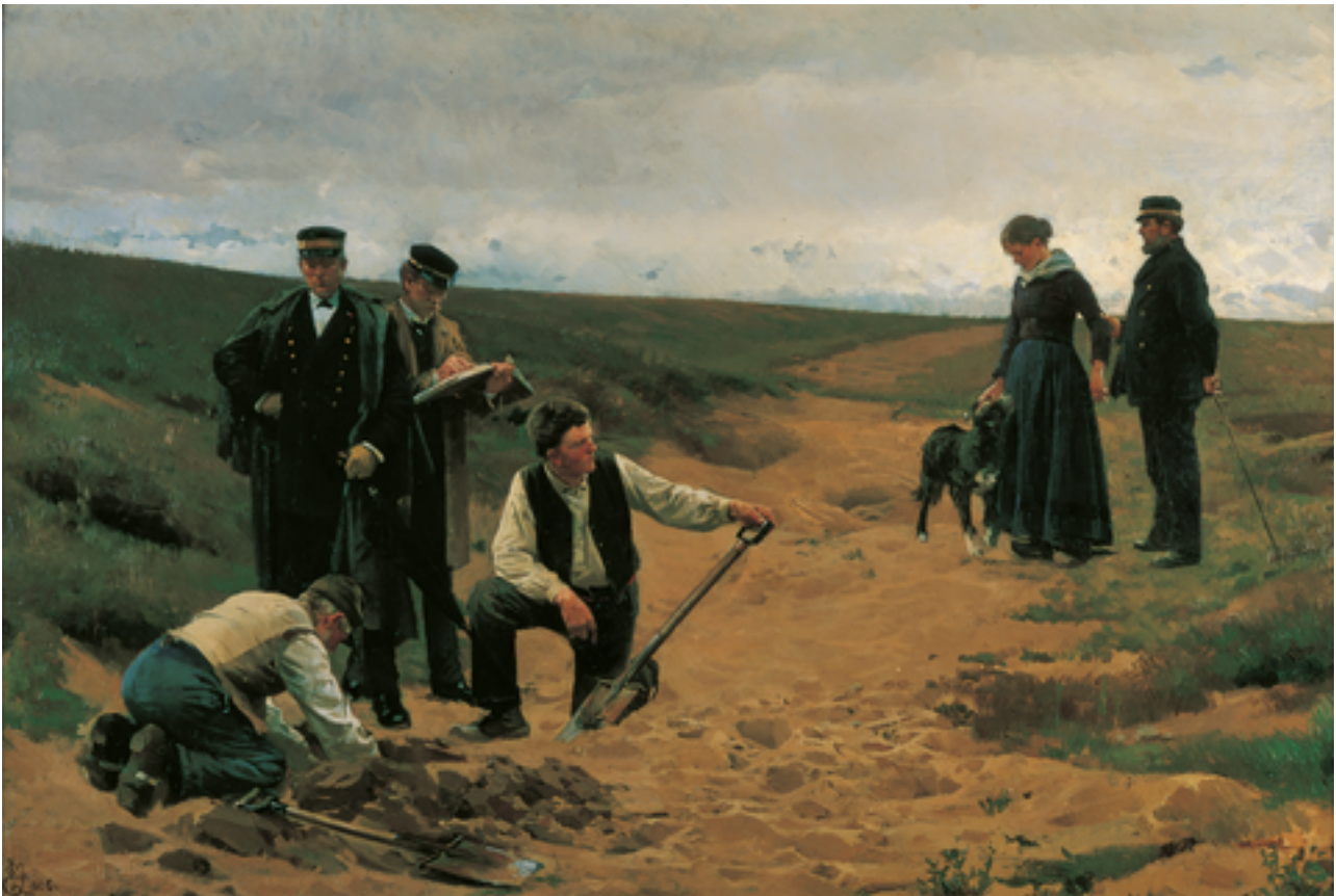
Erik Henningsen: "Barnemordet", 1886. Hvis en fattig kvinde i 1800-tallet blev gravid uden at være gift, blev hendes barn opfattet som "uægte". For at overleve i samfundet kunne kvinden blive nødt til at sende barnet væk eller slå det ihjel. På billedet graves et barnelig op, sådan at kvinden kan retsforfølges.

Naturalismens tankegang baserer sig på naturvidenskaben og afspejler det nye blik på mennesket. Mennesket er ikke skabt af Gud, men er et produkt af gener og miljøpåvirkninger. De naturvidenskabelige ideer banede vejen for at beskrive mennesket objektivt i litteraturen. Det ses bl.a. ved, at fortælleren ofte er alvidende og skrivestilen præges af detaljer, der iagttages objektivt. Menneskets handlinger forklares i Naturalismen som et produkt af arv og miljø . Det kan vi også se i periodens tekster, hvor mennesket beskrives som et produkt af fx fattigdom eller et mandsdomineret samfund. Naturalismens forestillinger er udtryk for det, man kalder den frie tanke : at man ser på mennesket med nye og helt neutrale øjne.