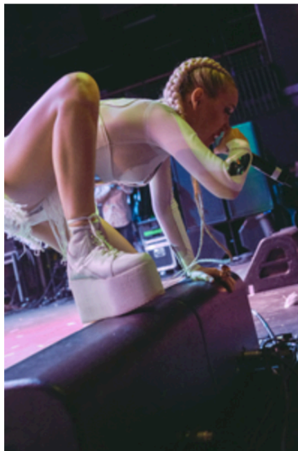
Brooke Candy på scenen i 2013.