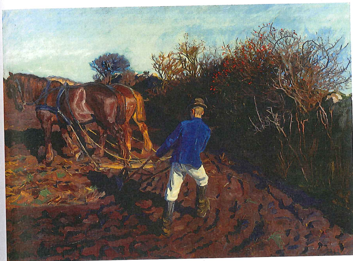
Peter Hansen: Pløjemanden vender. 1900-02. Olie på campoboard. 92 x 124 cm. Fåborg Museum, Fåborg.

men også fødder, og disse flytter sig fra land til by – og måske retur med en ny og farlig viden, der kan anfægte den folkelige tradition. Landbruget bliver moderniseret, tyendet får gradvis sine vilkår forbedret, og børnene en bedre uddannelse efter folkeskoleloven i 1903, der fører til etablering af en under-, mellem- og realskole samt et alment gymnasium. Politisk er verden i opbrud efter systemskiftet, og tankemæssigt brydes en folkelig grundtvigianisme med et kulturradikalt frisind. I sådan et opbrud er det vigtigt at kende og genfinde sine rødder.