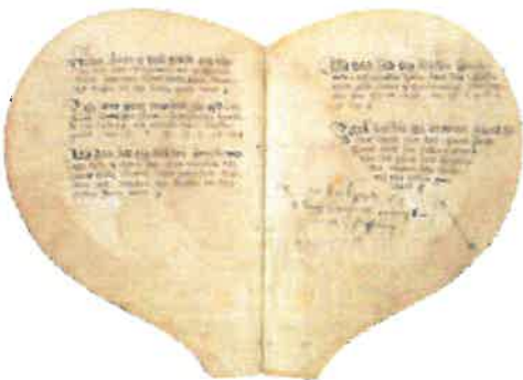
Side fra Hjertebogen. Det ældst bevarede visehåndskrift fra 1500-tallet. Det Kongelige Bibliotek, København.

Viserne er udtryk for en mundtlig fortællekultur, selv om nogle af viserne efter opfindelsen af bogtrykkerkunsten bliver nedskrevet og udbredt på skillingblade. Da poesibogen kommer på mode blandt adelens kvinder, nedskriver de viserne, og det er en sådan poesibog, der rummer det ældst bevarede håndskrift af en folkeviser. Den kaldes Hjertebogen , fordi dens form i opslået tilstand udgør et hjerte; den stammer fra midten af 1500-tallet.