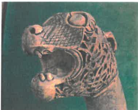
Dyrehovedstolpe fra Osebergskibet. Første halvdel af 800-tallet. Træ. Højde 52 cm. Vikingskibshallen, Bygdøy, Oslo.