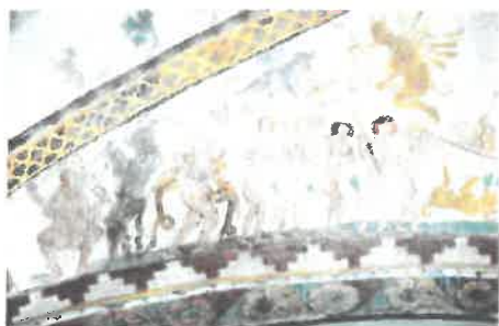
Kalkmaleri fra Birkerød kirke, 1325-50

Kalkmalerierne i de danske kirker udgør middelalderens store folkelige billedbog. På kirke-væggene iscenesattes livets og især dødens store mysterier i en form så menigheden, hvoraf meget få kunne læse og skrive, kunne fatte det. De fleste kirkers kalkmalerier bestod af lange serier af billeder koncentreret omkring synden og fortabelsen vs. nåden og frelsen. Men også optrin fra bibelhistorien var populære. I Birkerød Kirke findes der således en lang række billeder, der skildrer fx Kains drab på Abel og scener fra Jomfru Marias liv.