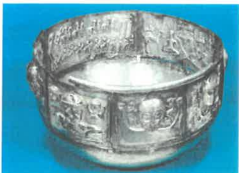
Gundestrupkarret. Sølvkar fra førromersk jernalder udført i Sydøsteuropa ca. 100 f.Kr. 69 cm i diameter, højde 42 cm. Nationalmuseet, København.