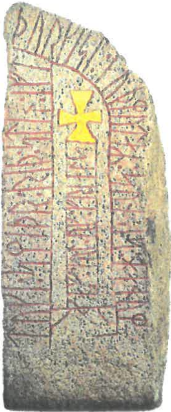
Hørning-stenen. Ca. 1000 – 1050. Højde ca. 160 cm. Forhistorisk Museum, Moesgaard, Århus.