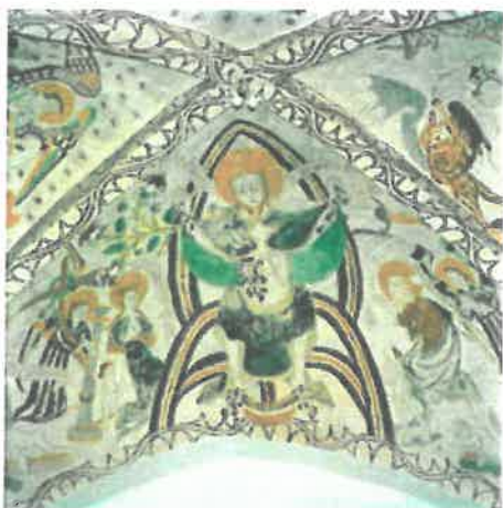
Kalkmaleri fra Mørkøv kirke, 1460-80

Det billede, vi har gengivet på denne side, er et yndet motiv i mange kirker: nemlig de fortabte sjæle, der efter den såkaldte 'sjælevejning' er fundet for lette. De må nu vandre den tunge gang til de evige luer. På scenen her ser vi – ikke ulig de kontante beskrivelser i Dantes fremstilling af Helvede – forskellige pinsler, som de fortabte må udstå: de ristes over ild, ørne hakker i deres lever, eller de overfaldes i mere eller mindre seksuelle iscenesættelser af djævlige og uhyrer. Nogle er gennemstukne af spyd og sværd, andre vrider blot i afmagt deres hænder.