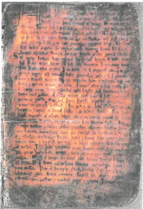
Pergamenthåndskrift med Vølvens spådom. Island. Ca. 1200. 19,4 x 13,4 cm.