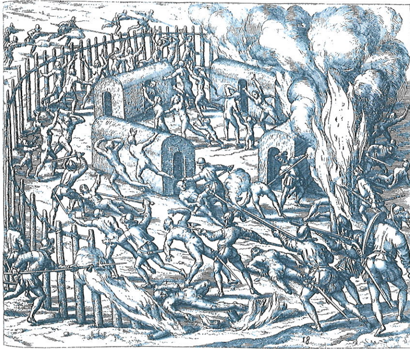
Billede fra Colombia fra 1510. Spanske soldater myrder ubevæbnede indianere.

spanske søfarere primært undersøgelseslejdsere langs kysten af det nye kontinents hovedland. Søvejen til Indien havde stadigvæk første prioritet og jagten på en passage igennem det nye kontinent var helt central.