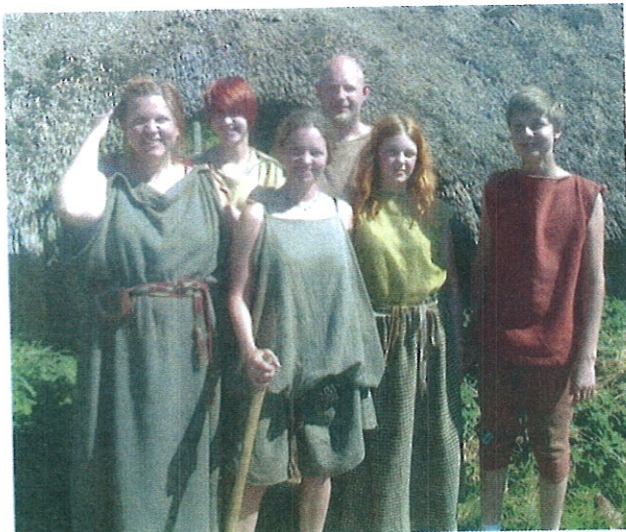
Tilbage til naturen. Moderne mennesker kan opleve ro og fællesskab ved fx at leve som jernaldermennesker i sommerferien. Her Lejre 2012.

※ Erindringspolitik: Når en gruppes kollektive erindring styres eller påvirkes med et politisk formål.