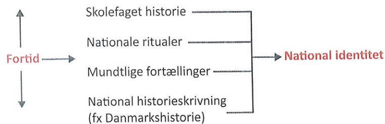
Figur 4 Skabelse af national identitet gennem kollektiv erindring

Nogle fortællinger om fortid bliver en del af den kollektive erindring. Andre glemmes bevidst eller ubevidst, fordi de ikke passer ind i den nationale selvforståelse.