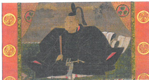
Portræt af Shogun Tokugawa Ieyasu (1543-1616) fra det 17. århundrede.

Japan var i 1500-tallet et splittet rige præget af endeløse stridigheder mellem forskellige fyrster. Under en svækket centralmagt blev konflikter i stigende grad løst med militære midler. Udover de interne stridigheder blev Japan også presset udefra. Jesuit-munke fra Portugal ankom i 1543, og siden hen fulgte portugisiske handelsfolk, der medbragte musketter, matematik og teknologi. I de interne magtkampe vandt hærlederen Oda Nobunaga (1534-1582) større og større områder af det nuværende Japan fra 1559 og frem. Han undertvang sig potentielle rivaler først i det vestlige, siden det østlige og til sidst det nordlige Japan med hjælp fra sin dygtige general Toyotomi Hideyoshi (1536-1598). Hideyoshi videreførte eroblingsprojektet og udviklingen af en centraliseret stat, efter at Oda Nobunaga var blevet myrdet. Til at administrere den østlige del af de nyerobrede områder indsatte Hideyoshi sin loyale general Tokugawa Ieyasu (1543-1616). Tokugawa Ieyasu fik hovedsæde i den lille fiskerby Edo (nutidens Tokyo).