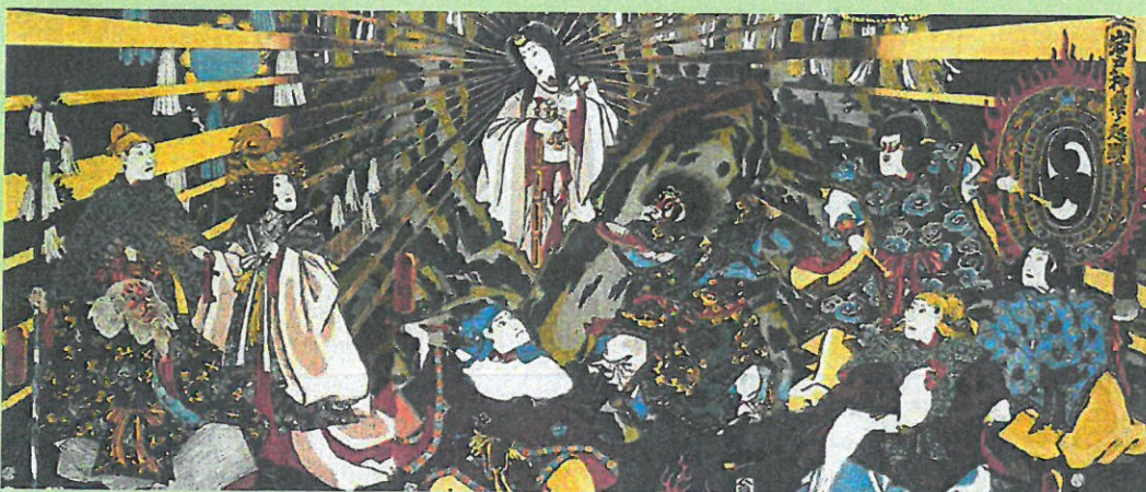
Solgudinden Amaterasu. Indtil 1868 var skellet mellem shinto og buddhisme ikke skarpt. Således anså man ofte Amaterasu som en måde, hvorpå Buddha Vairocana (den kosmiske buddha) viste sig.

Izanami døde, og Izanagi skabte selv solgudinden Amaterasu, der senere sendte sit barnebarn Ninigi ned for at regere Japan og rense landet for uregerlige guder. Ninigi blev identificeret med den mytiske kejser Jimmu, der steg ned til de japanske øer og blev den første jordiske kejser i Japan den 11. februar 660 f.v.t.. Dermed var kejserslægtens guddommelige ophav blevet etableret.