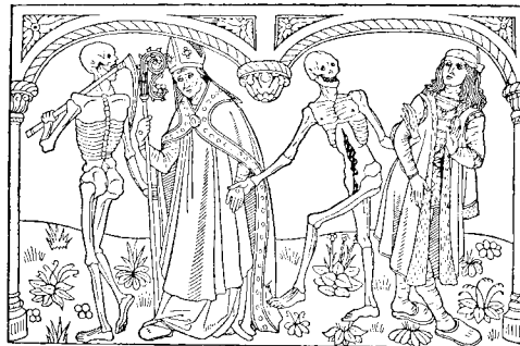
Ill. 33: Dødedansen – et yndet motiv i senmiddelalderens kunst: Døden byder til dans uafhængig af stand. Den sociale satire gav muligvis samfundets bund en – ringe – trøst, men først og fremmest er budskabet, at døden er anonym og ikke kan trodses. Døden er ikke en magt, man kan protestere overfor og måske – med Guds hjælp – besejre. Døden er en livsskæbne, ikke en livsfjende. Træsnit fra Guyot Marchant: Danse macabre, 1485.

Efter: Livsanskuelse gennem Tiderne. Middelalderen, Gyldendal 1956, p. 143-45.